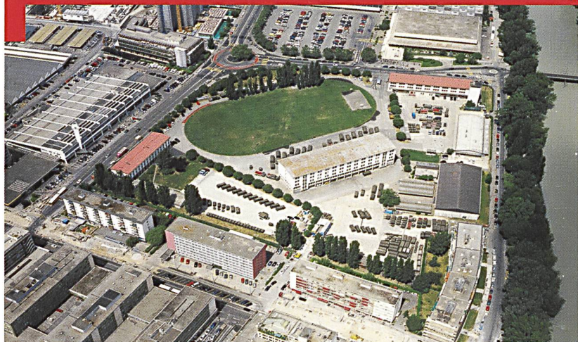
Vue aérienne de la caserne des Vernets; le bâtiment principal non rénové est bien visible au centre.