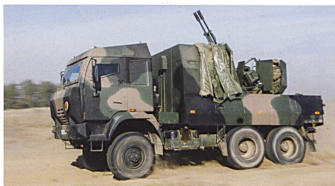
Un ZSU 23-2 monté sur un camion et un Dana de 152 mm de l'armée polonaise. Ils servent à l'appui direct des formations de combat.