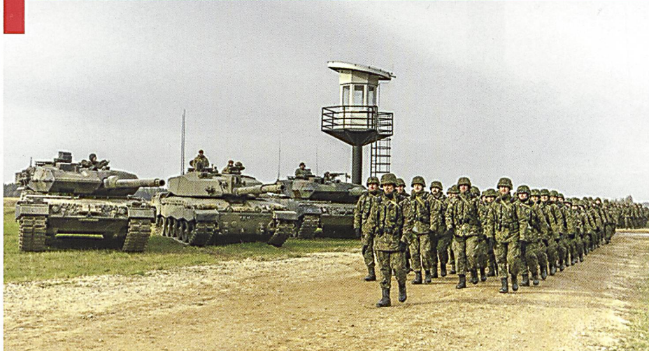
Défilé devant un alignement de chars Léopard 2 allemands et polonais, entourant un Challenger 2 britannique.