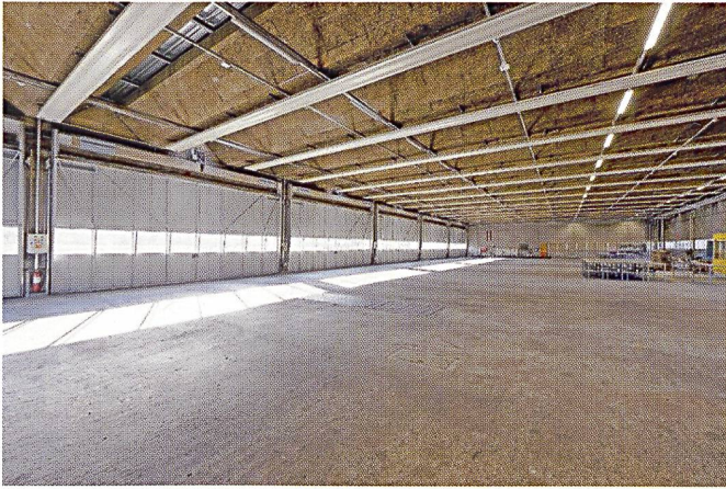
Ci-dessus: L'intérieur d'une halle de chars.

n'est pas idéal. La fraction UDC/PLR a ainsi posé la question au SEM dans une lettre ouverte: « Cela a-t-il un sens de placer des personnes qui fuient la guerre, dans une place d'armes où s'entraînent des militaires où se trouve du matériel sensible et de la munition à proximité immédiate, et où roulent constamment des chars? » Une autre question posée était la suivante: « Quelles sont les conséquences et les limitations imposées à l'exploitation et au déroulement des cours sur la place d'armes de Thouné? » Ou encore: « Est-il possible, dans ces conditions, de garantir une instruction de bonne qualité pour les recrues et les cadres? » En effet, on peut se demander si c'est à l'armée, encore une fois, de passer à la caisse et de s'adapter.