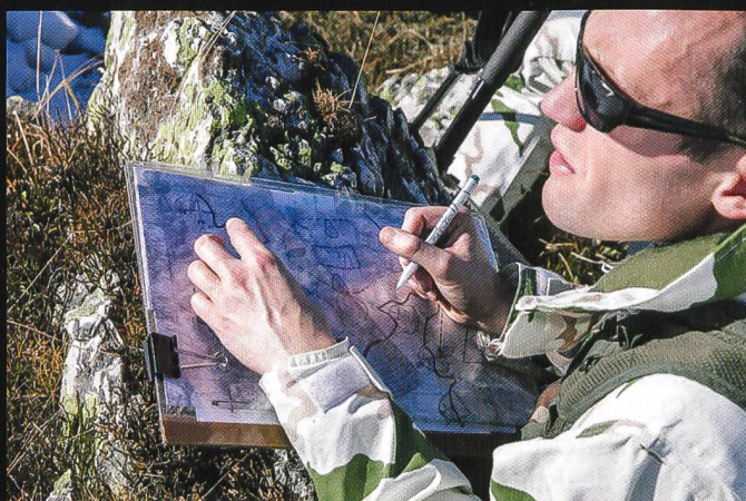
L'observation et la direction des feux nécessitent une grande expérience, en raison de la nature accidentée et de la météo capricieuse.