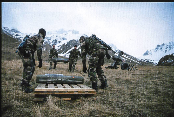
Les artilleurs sont en mesure d'engager indifféremment le mortier de 12 cm ou l'obusier de 155 mm César . Le premier a une portée d'une dizaine de km. Le second est en mesure d'atteindre un but à 40 km.