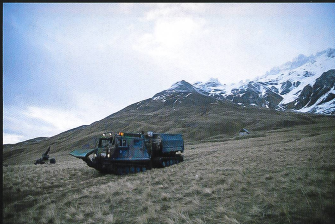
La munition est acheminée en terrain difficile par des chenillettes Bv206 de conception suédoise.