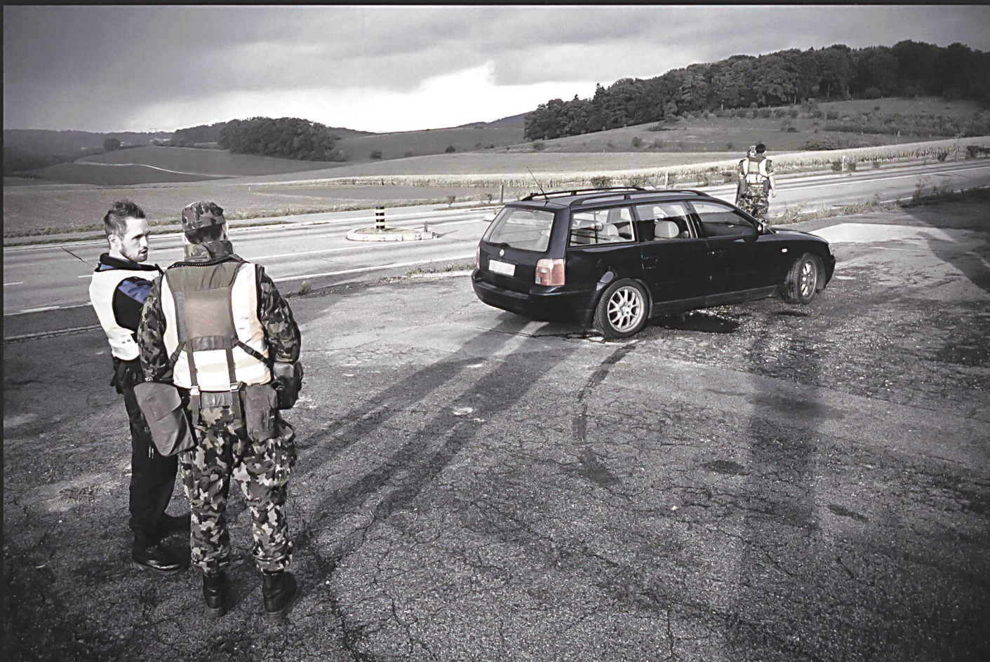
Ci-dessus: checkpoint mobile gardes-frontière / fantassins de la cp car 14/3. La collaboration entre ces deux entités s'est déroulée sans accroc et chacun eut aussi l'opportunité d'exercer une deuxième langue fédérale à cette occasion. Par ailleurs, cet engagement aura également permis de faire découvrir la profession de garde-frontière aux hommes du bat car 14, certains ayant montré un très fort intérêt pour cette filière.