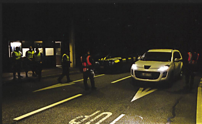
Dans le sens des aiguilles d'une montre: Eagle en patrouille en zone forestière; engagement mixte entre gardes-frontière et militaires du bat car 14 sur deux postes-frontières ; garde-frontière contrôlant l'authenticité d'une carte d'identité.