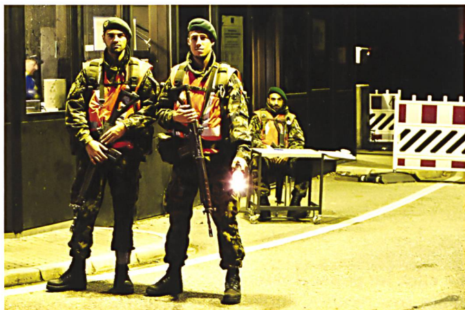
L'engagement de l'armée suisse aux frontières est peu fréquente. Dans le cas de CONEX 15, il découragea nombre de larcins, de vols et de cambriolages durant toute la durée de notre déploiement. Il rassura également les populations locales, qui apprécièrent notre présence et le firent savoir !