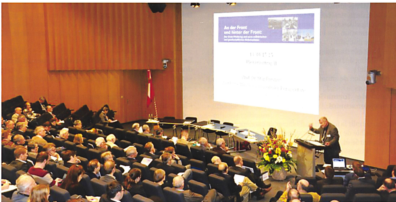
Une conférence organisée de concert entre la MILAK et l'Ecole polytechnique de Zurich.

supérieurs et leur permet d'élargir leurs connaissances dans le domaine de la politique de sécurité, de la conduite opérative et des sciences militaires.