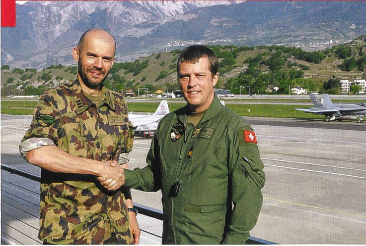
Changement de commandants à la base aérienne de Sion.