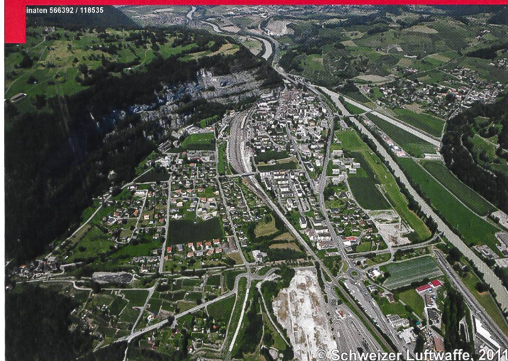
Le défilé de Saint-Maurice vu en direction du Nord avec le plateau de Vérossaz (à gauche) et Chiètres (à droite).