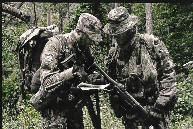
La compagnie d'état-major carabiniers 14 comprend une section d'exploration, équipée de 5 Eagles.