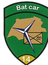
Présentation des cadres du bat car 14 au Centre d'instruction au combat Est.