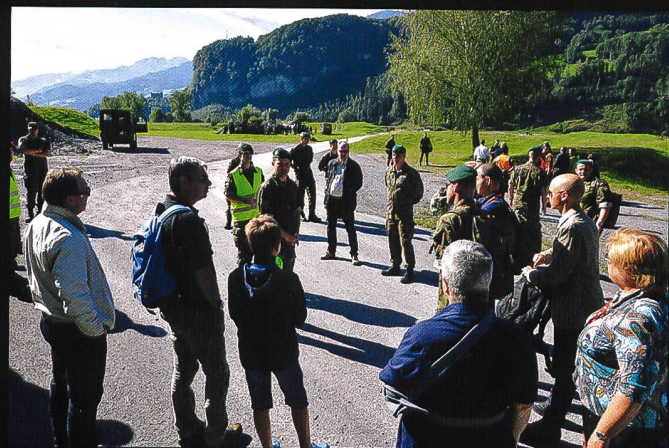
L'exercice HELIPOLI 14, qui présente le bataillon de carabiniers genevois à une délégation d'invités, en présence du brigadier Mathias Tüscher.