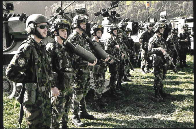
Présentation des moyens d'un groupe de carabiniers, monté indifféremment sur Piranha 8x8 ou sur Duro GMTF .