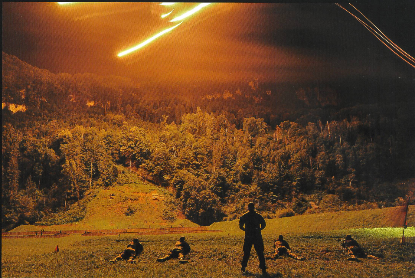
Exercice HEPHAÏSTOS – tirs de combat et de nuit, du bat car 14.