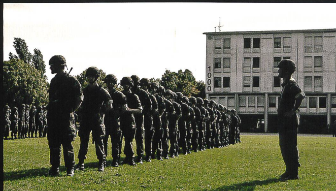
Ci-dessus : Préparatifs de la prise du drapeau du bataillon de carabiniers 14 à la caserne des Vernets. Ci-dessous : Déplacement en train spécial vers le secteur du cours de répétition : Walenstadt - St. Luzisteig.