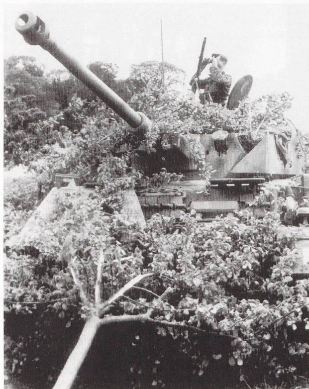
Ci-dessus : un PzKpfw IV Ausf. G du II./SS-Pz.Rgt. 12 près de Caen, durant l'été 1944.