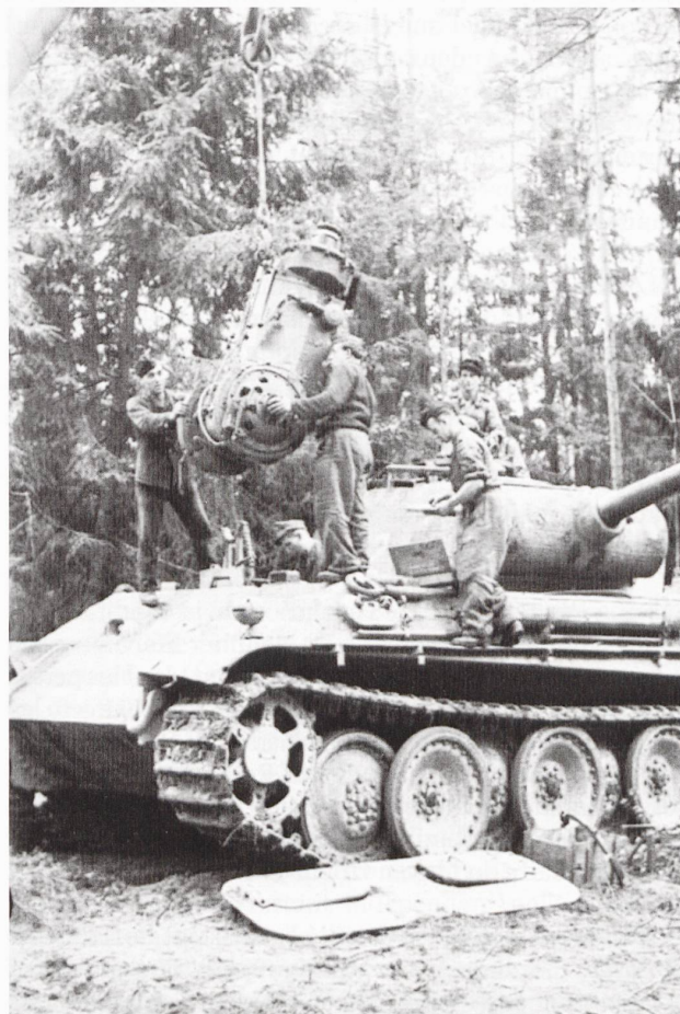
Ci-dessous : changement de la boîte de vitesse d'un PzKpfw V Panther Ausf. A en Russie, été 1944.