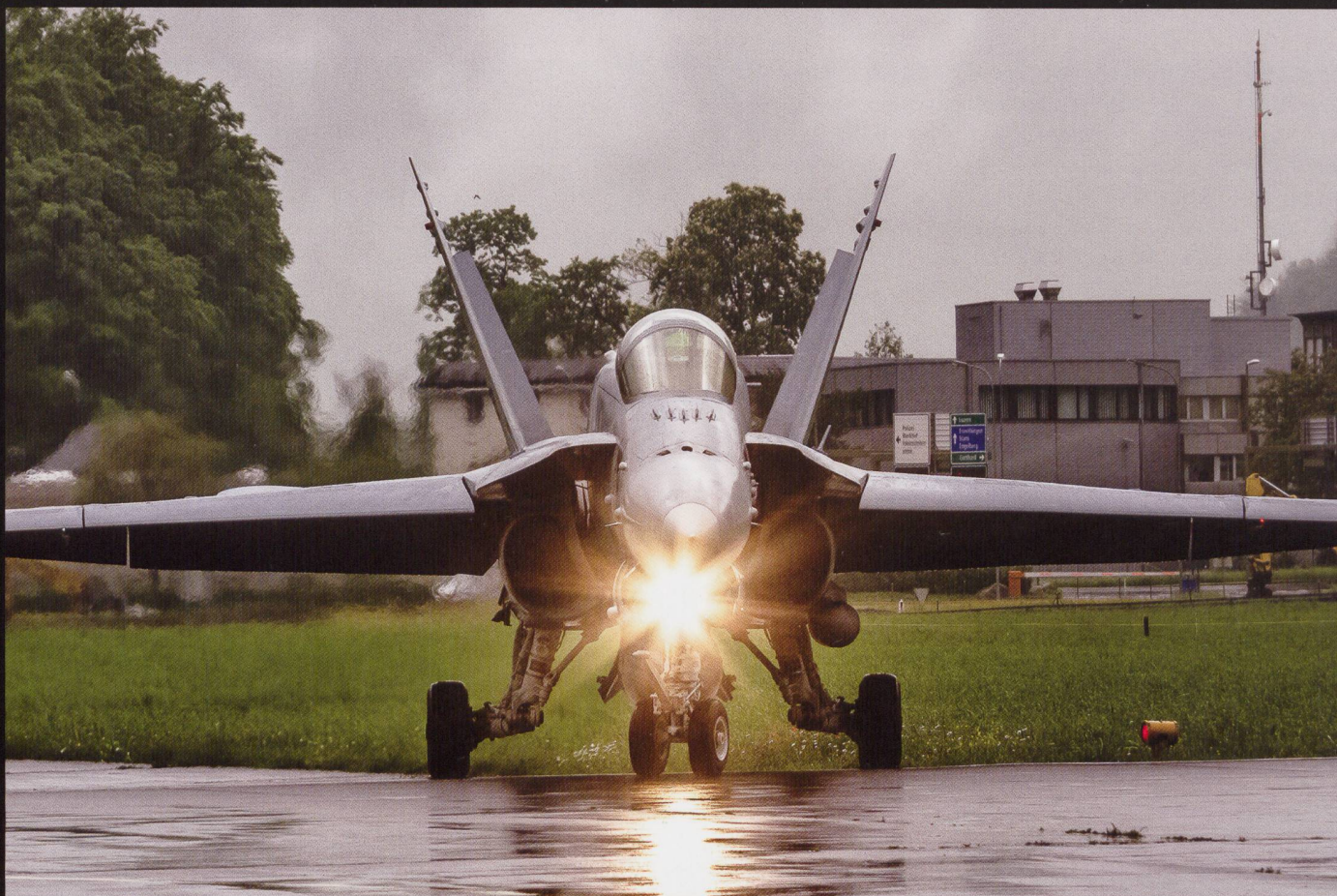
Hornets sous la pluie. Merci à Antony Shaf pour ces photos d'un exercice sur l'aérodrome de Buochs (NW).