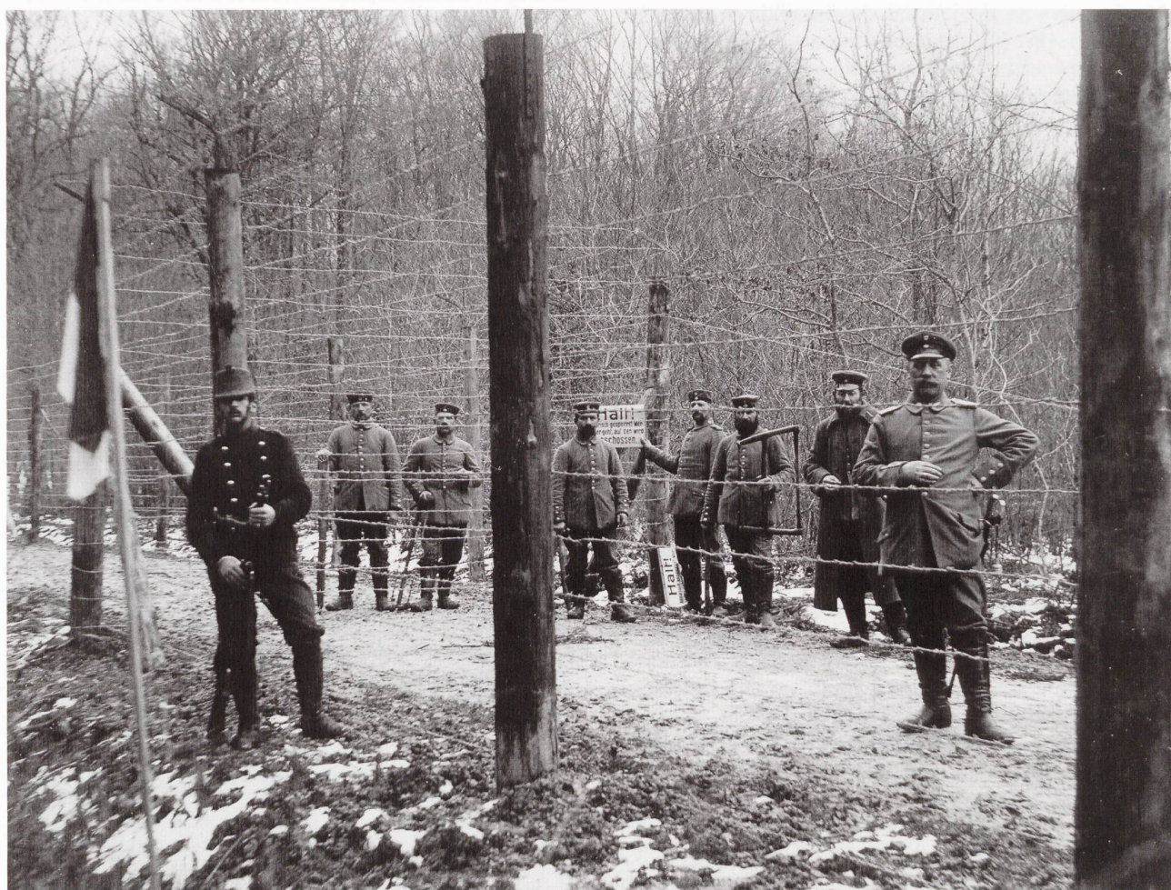
La barrière allemande à la frontière du Largin.

En arrivant dans la position, on ressent une émotion, une sorte de malaise. On est là, debout, comme protégé par le drapeau rouge à croix blanche, observé par des centaines d'yeux invisibles. On veille, on guette l'indice qui annoncerait une attaque contre le pays, ce qui n'empêche pas d'avoir des contacts avec les voisins français et allemands, de faire avec eux de menus échanges. On doit parfois éprouver un sentiment d'impuissance, quand les artilleries belligérantes se déchaînent. Tous les citoyens-soldats souhaitent passer dans cet avant-poste, cette première ligne où ils se trouveront au contact des soldats des deux camps, qui se battent, souffrent et subissent les