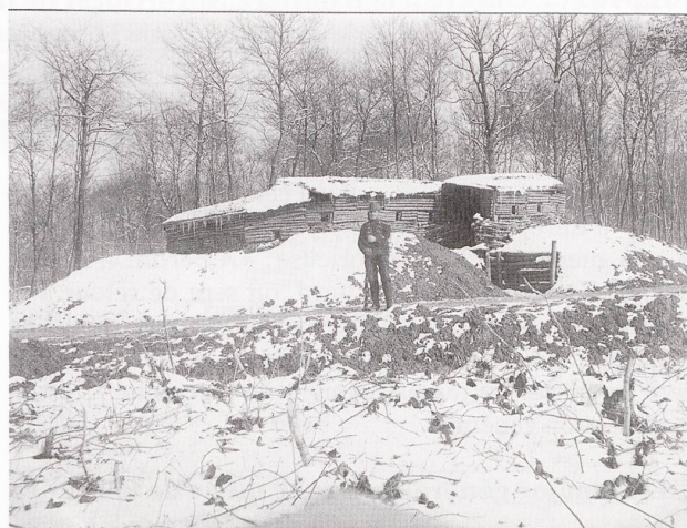
Largin : Le poste d'observation Sud en 1915.

père ne m'a jamais raconté exactement comment il s'y est pris, mais toujours est-il qu'au moment de manger, les soldats suisses, allemands et français se retrouvèrent réunis, sur le territoire suisse, autour d'une table couverte de mets spécialement préparés et de bougies allumées. Ils étaient une vingtaine ou une trentaine d'hommes qui avaient réussi à faire ce que les politiciens de leurs pays respectifs ne parvinrent à réaliser que quelques années plus tard : la paix autour d'une table. Les hommes des différentes nationalités se jurèrent mutuellement de ne plus tirer les uns sur les autres. (...) Quelques jours plus tard, (...) mon grand-père et ses compagnons apprirent que leurs invités étrangers avaient été mutés sur d'autres fronts où ils étaient de nouveau obligés de tirer sur des ennemis inconnus 3 . »