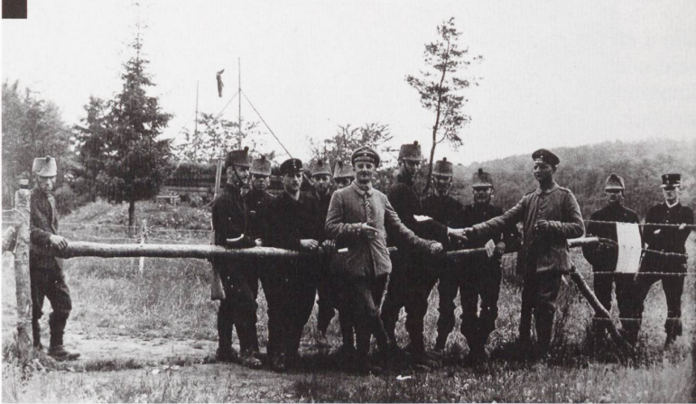
Au Largin, des soldats suisses posent avec des gradés allemands. Tout à droite un garde-frontière suisse.