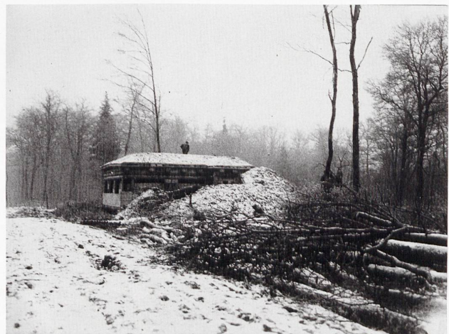
Largin : Le poste d'observation Nord, construit en 1915.

La Suisse, devenue un lieu de transit utile pour les deux camps, travaille au profit des belligérants. Leurs commandes stimulent l'exportation de produits utiles à l'effort de guerre, comme les composantes horlogères, les produits manufacturés, les denrées