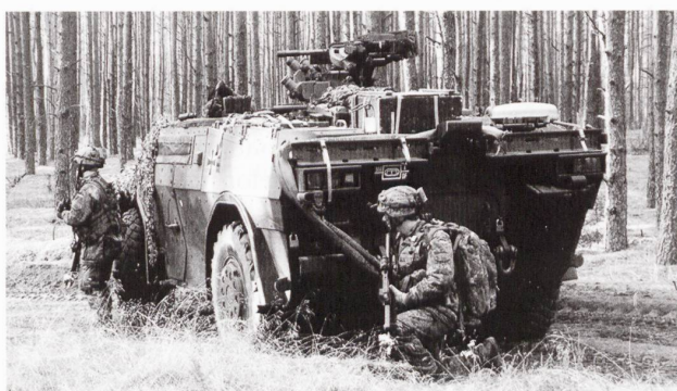
Les Néerlandais et les Allemands ont engagé des unités d'exploration équipées du Fennek .

L'exploration aérienne n'a pas été ignorée. Les formations d'exploration modernes sont appuyées par des drones tactiques.