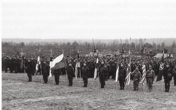
Ci-dessus : Les exercices de l'OTAN à l'Est s'intensifient et rassemblent désormais des effectifs de plus en plus importants : 1'500 en octobre, 2'500 en novembre 2014.