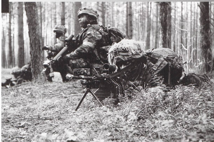
La Force ROUGE a été représentée par un contingent d'infanterie canadien.