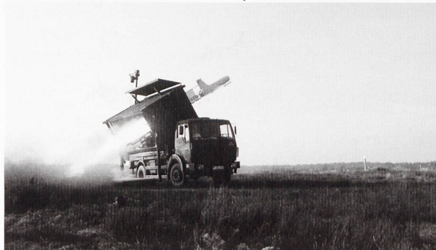
Ci-dessous : Lancement d'un drone tactique lors d'IRON SWORD 2014.