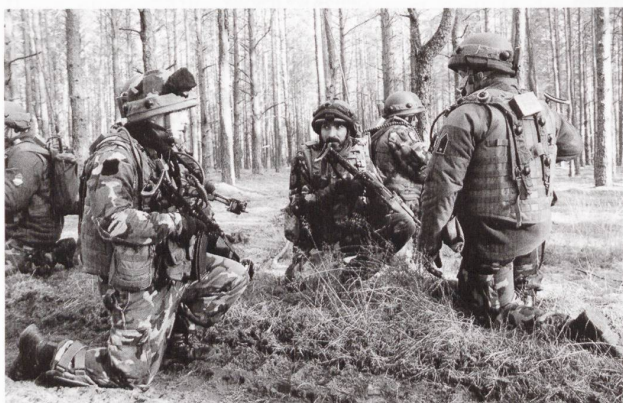
Ci-dessus : Des fantassins de la 5 e brigade hongroise « Bocskai Istvan. »