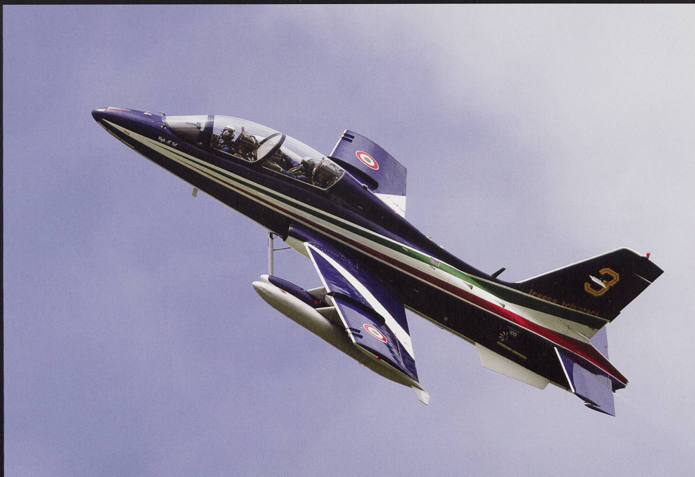
Page précédente, de haut en bas: Eurofighter Typhoon et F/A-18C « solo display. » CF-188 canadien. Eurofighter et Rafale . Tornado IDS. Cette page: Les patrouilles italienne (Frecce Tricolori) et britannique (Red Arrows). Toutes les illustrations © Loïc Roulin.