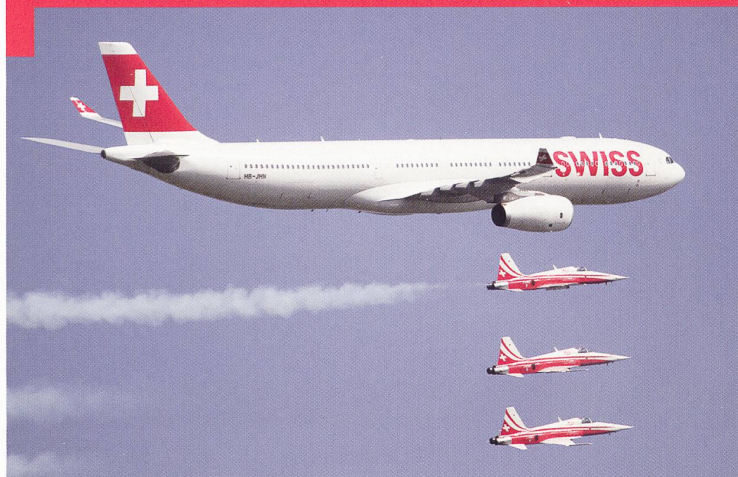
Un Airbus A340 de Swiss, en formation avec la Patrouille suisse.