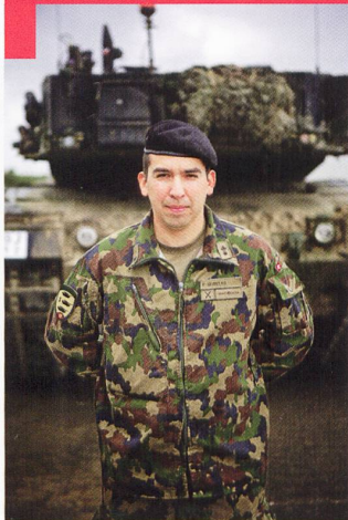
Bat chars 17