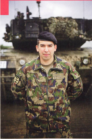
Bat chars 17