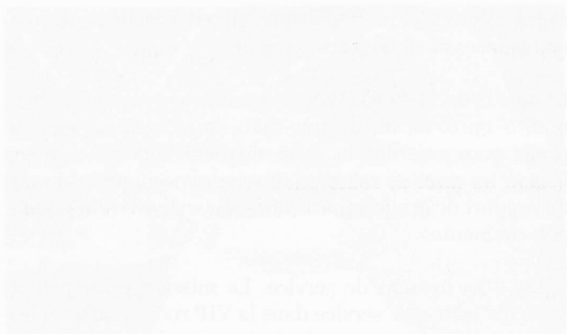
Le plt Quintas, à Bure.

L'une des premières problématiques a concerné le nombre de soldat à fournir : entre le nombre de soldats