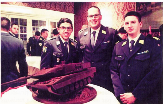
Ci-dessus : l'Assemblée générale 2014 de l'OG Panzer s'est tenue à Zürich, dans un cadre somptueux.