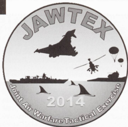
L'insigne officiel de l'exercice tactique aérien JAWTEX.

Toutes les illustrations fournies par l'auteur.