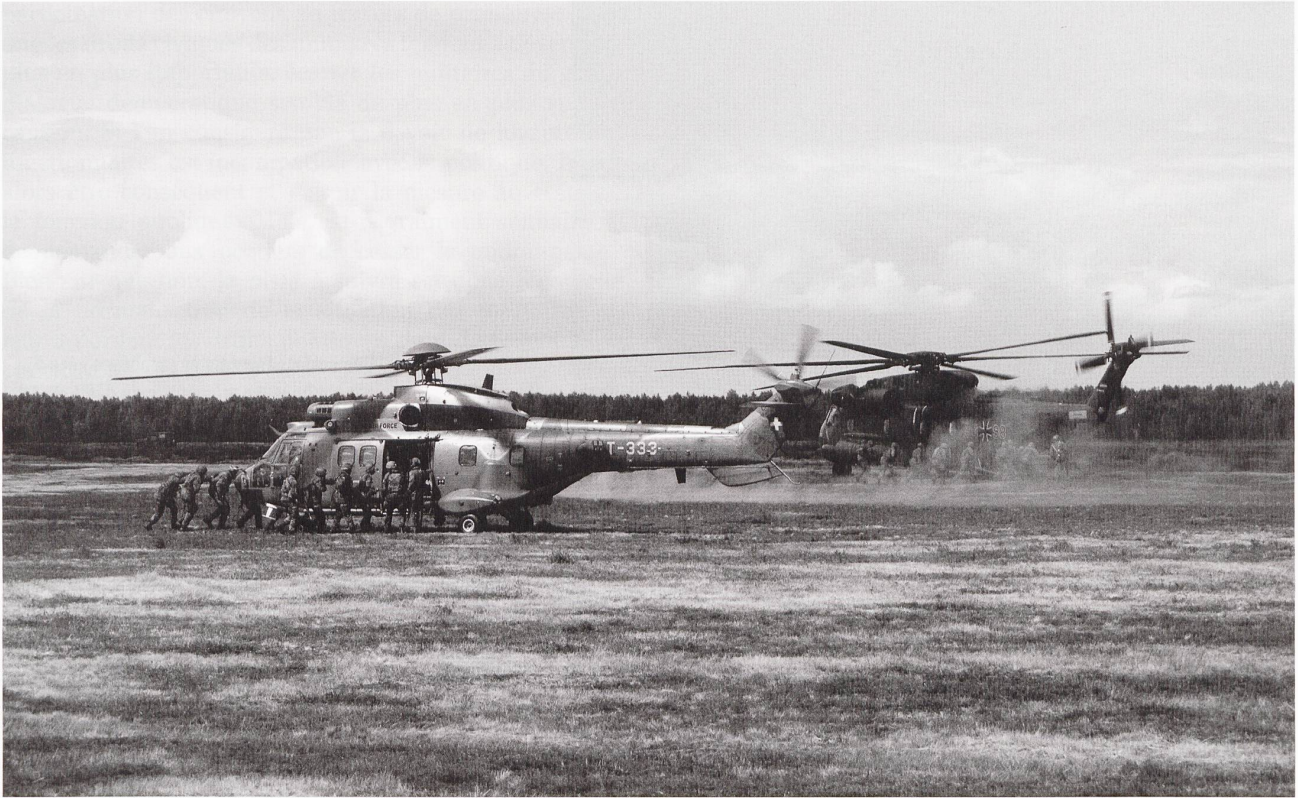
Embarquement de troupe sur Cougar (CH) et CH53 (D).

et sur la mer. Ceci, afin de remplir les missions assignées tout en garantissant un support mutuel optimal. Le scénario, fictif et quelque peu complexe, se basait sur une situation politique initiale qui a révélé, par un pur hasard, d'étonnantes similitudes avec des situations d'actualités.