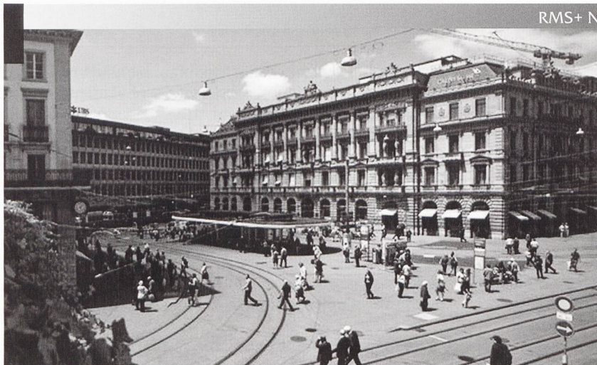
Le quartier des banques, à Zurich. Cet article a été à l'origine rédigé pour l'ASMZ. Il paraît ici avec l'aimable autorisation de son rédacteur en chef.