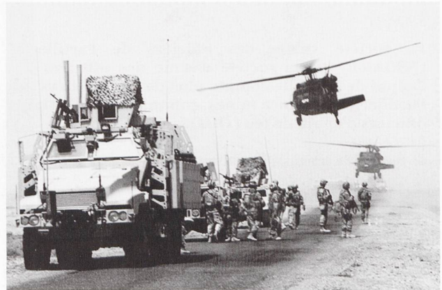
La sécurité des axes, des convois et des transports a été un enjeu majeur pour assurer la stabilité et la reconstruction économique de l'Irak depuis 2003.