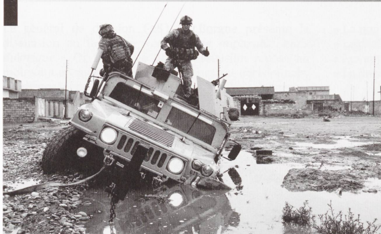
Un Hummer surblindé en fâcheuse posture en Irak. L'US Army a appris à ses dépens que les véhicules blindés légers étaient trop légers et pas assez blindés.