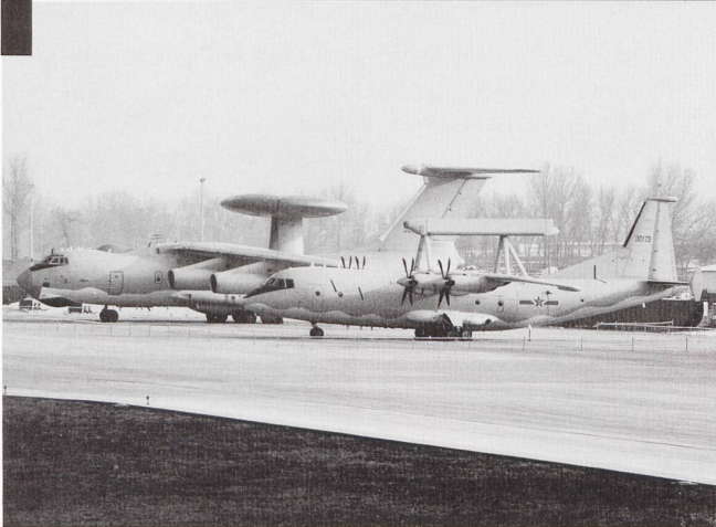
Côte à côte, le KJ-200 (premier plan) et le KJ-2000. Le premier est également décliné dans une version de surveillance électronique, baptisée Y-8.