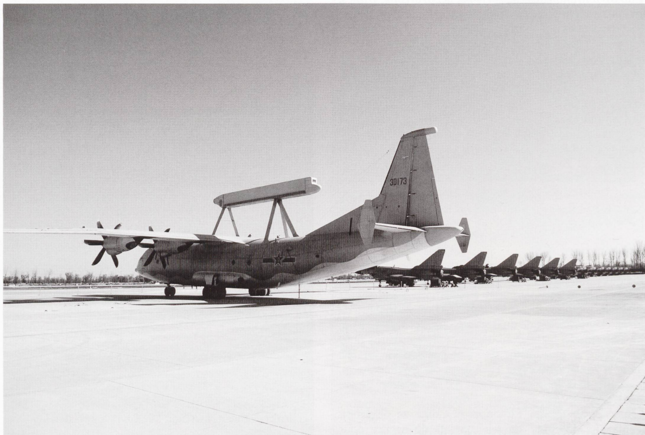
Un J-200 aligné à côté d'une rangée de chasseurs J-10.