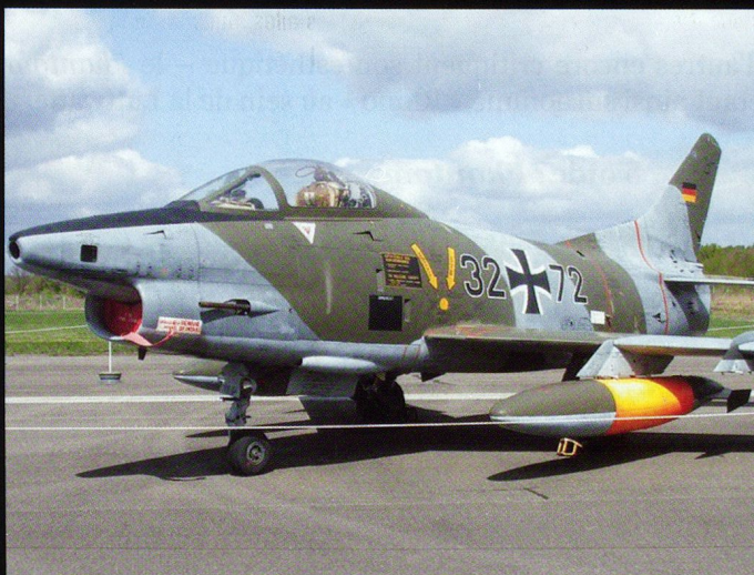
Lointain cousin du Sabre , le Fiat G-91R était destiné à la reconnaissance ou à l'attaque au sol.