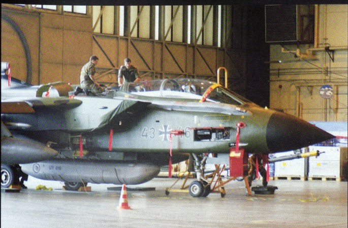
Un Tornado IDS (Interdiction and Strike) durant l'exercice COOPERATIVE COPE THUNDER en 2004.