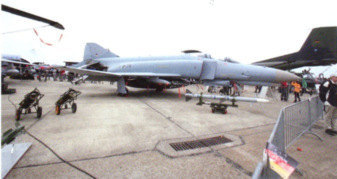
Le F4F revalorisé (ICE) reçoit un nouveau radar ainsi qu'un armement air-air sensiblement plus performant, sous la forme de l'AIM-120 AMRAAM présenté sous le ventre de ces deux appareils.