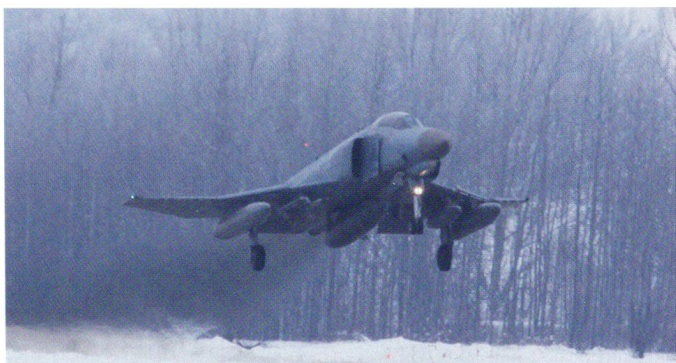
Un F-4F ICE de la JG 71 déployé en Lituanie, afin d'assurer la défense aérienne des Etats baltes.

d'autres encore critiquent son esthétique – le Phantom étant ainsi surnommé « Rhino » au sein de la Luftwaffe.