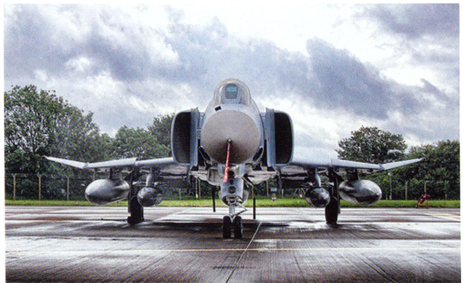
Présentation au sol du F-4F ICE. Celui-ci est armé d'un canon de 20 mm M-61 sous le nez et peut emporter jusqu'à 4 AIM-9 Sidewinder et 4 AIM-120 AMRAAM.

On comprend dès lors qu'avec l'entrée en service de l' Eurofighter , la JG 73 a abandonnée le F-4F dès 2002 ; la JG 74 en 2008. Les derniers F-4F encore en service ont été officiellement retirés cet été à Witmundhafen au