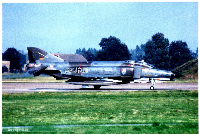
Les RF-4E de reconnaissance ont quant à eux reçu une livrée de trois tons de vert, baptisée « Lézard. »