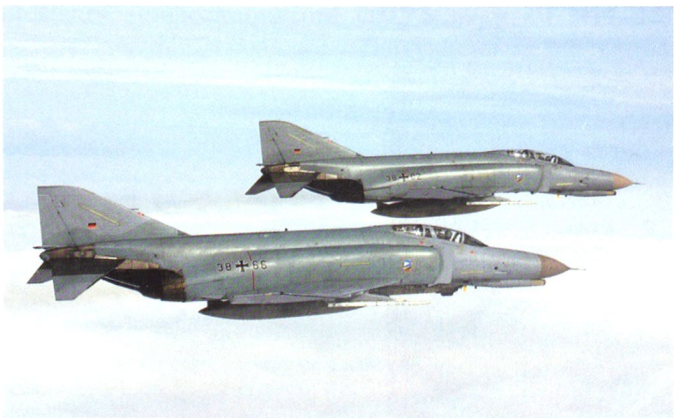
Ci-dessus : vue du F-4F ICE dans sa livrée « Norm 90. »

Des systèmes de flash permettaient la photographie de jour comme de nuit. Un système infrarouge ainsi qu'un radar (IRRS et SLAR) ont été adapté dans le flanc du fuselage. Les photos pouvaient être développées en vol et parachutées dans une capsule, permettant d'accélérer l'analyse et l'exploitation de celles-ci. La livraison de ces appareils, à la cadence de huit par mois, a duré jusqu'en mai 1972. Les appareils ont servi au sein des Aufklärungsgeschwader (AG) 51 « Immelmann » et 52, basés à Leck.