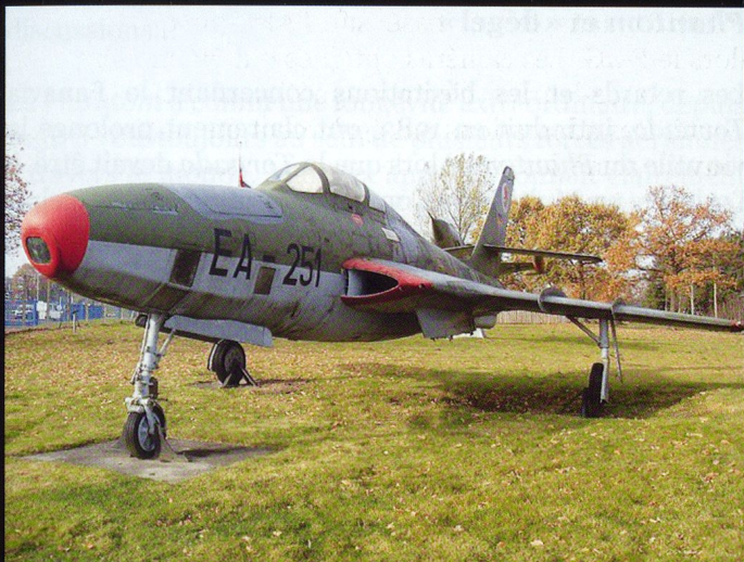
Le RF-84 est la version dédiée de reconnaissance, baptisée Thunderflash . Celui-ci est exposé au musée de Jagel.