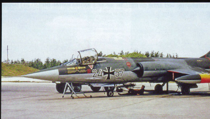
Un RF-104 de reconnaissance.