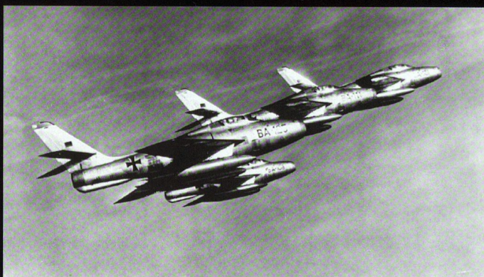
L'entrée en service du F-84 Thunderjet a donné à la Luftwaffe un appareil plus polyvalent.