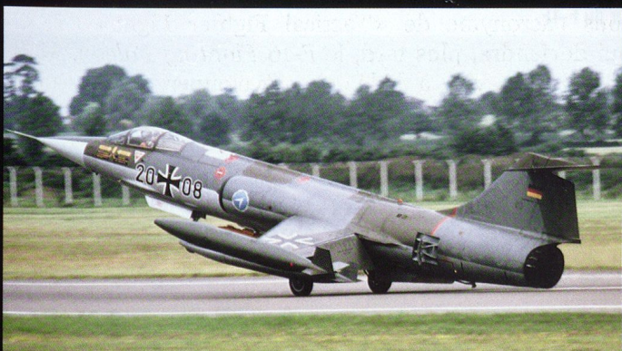
Le F-104G Starfighter « faiseur de veuves » au sein de la Luftwaffe.