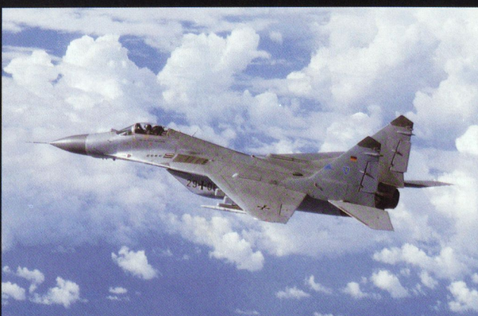
Un des 24 MiG-29A repris de l'ex NVA.