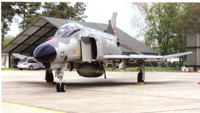
Le camouflage « Norm 81, » développé aux USA, consiste en une application de gris clairs sur le fuselage et les ailes, mais un ton plus foncé sur les parties supérieures de l'appareil.