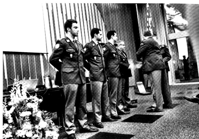
Le président félicite les nouveaux membres.