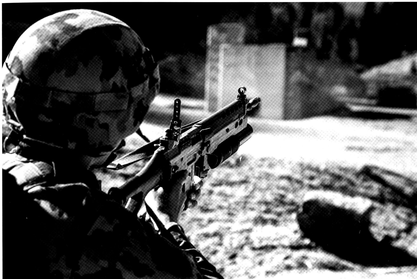
Tir avec le lance grenade additionnel.