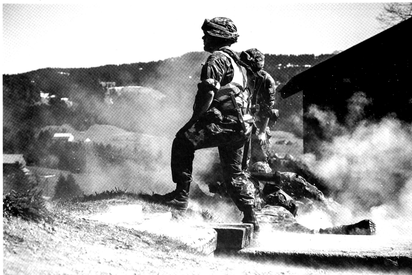
Départ du coup lors du tir avec un Panzerfaust UPat.