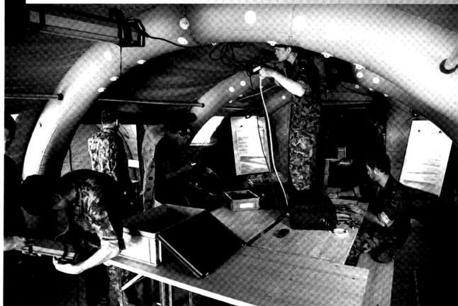
Cp EM chars 17