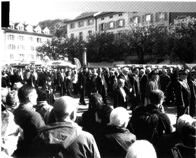
Bat chars 17