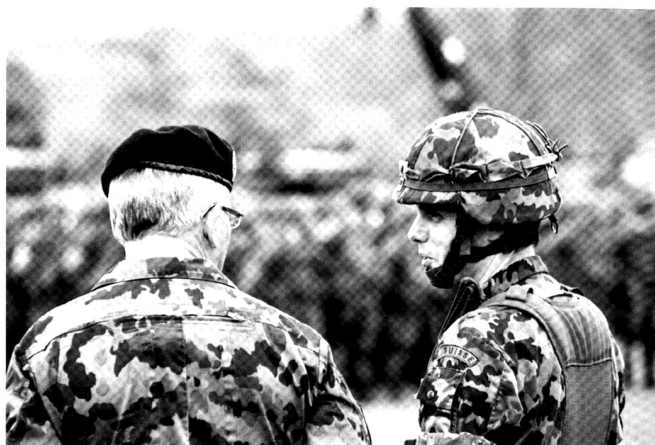
Le commandant de bataillon aux côtés du commandant de brigade.

Introduction à l'exercice REAL, par le commandant de bataillon.