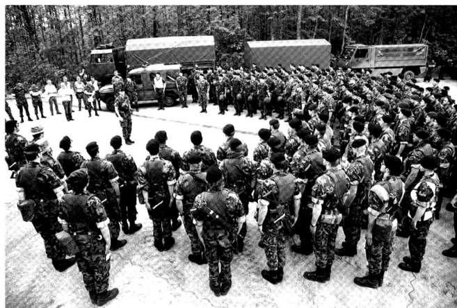
Les grenadiers de la compagnie 17/4 lors d'un entraînement avec la grenade à main 85.

Introduction à l'exercice REAL, par le commandant de bataillon.