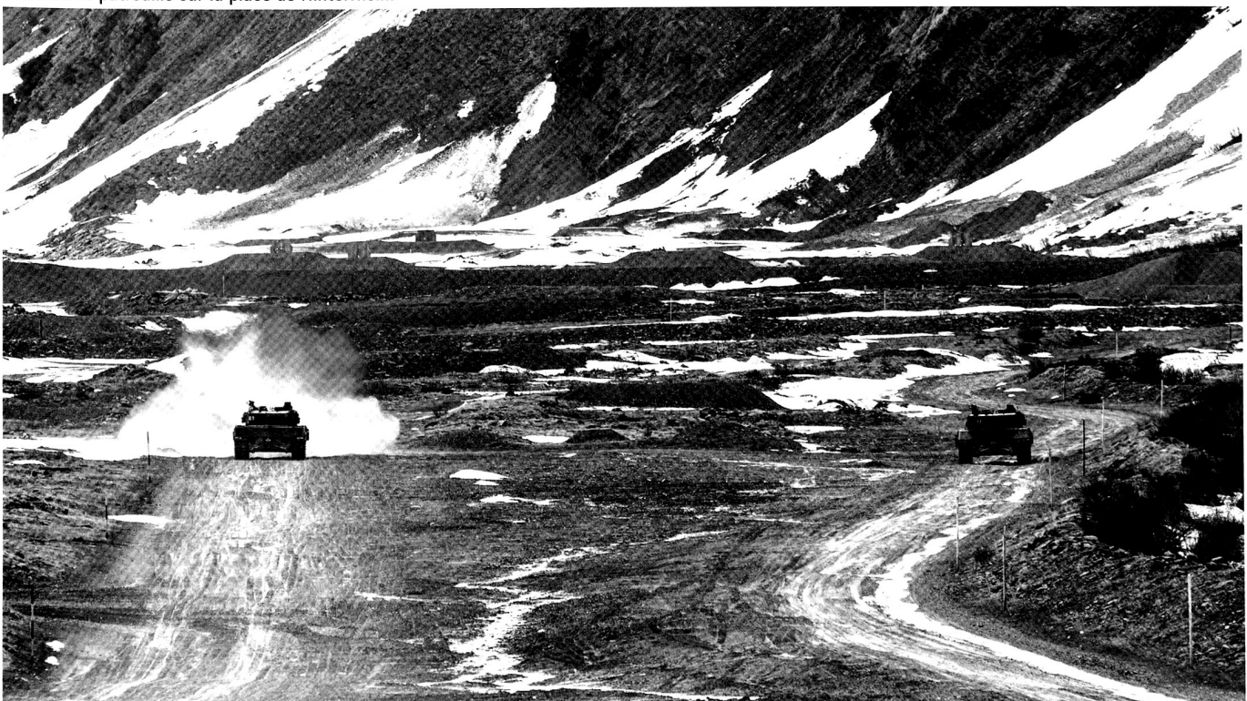
Exercice de patrouille sur la place de Hinterrhein.

Grâce à l'intensité élevée du cours et malgré les petits effectifs du bataillon, le programme et les missions subsidiaires, telle que la préparation à un éventuel engagement au profit des Forces terrestres, ont pu être presque entièrement réalisés. Les soldats ont démontré, après avoir rafraîchi leurs connaissances, une bonne maîtrise technique de leurs armes et de leur matériel. Cependant, une marge de progression indéniable existe encore au niveau de l'engagement tactique et de la technique de combat, notamment celle du combattant individuel. Le bataillon aura l'occasion de démontrer une nouvelle fois ses compétences dans ces domaines lors de son cours 2014 sur la place d'armes de Bure.