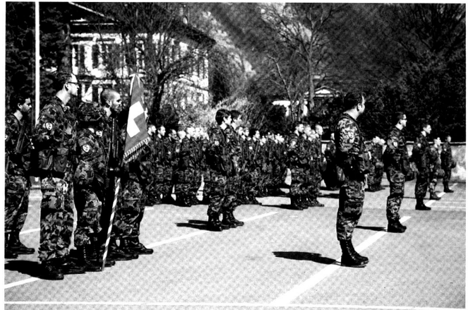
Le bataillon lors de la prise de l'Etendard lors de la semaine du cours cadre.

Glarus Süd ist gewillt, die guten Beziehungen, die zwischen der Armee und der ehemaligen Gemeinde Elm bestanden, in gleicher Weise fortzusetzen. Wir sind stolz und freuen uns, Angehörige der Armee aus allen Teilen der Schweiz bei uns begrüssen und beherbergen zu dürfen und hoffen, dass ihnen neben den Übungen auch etwas Zeit bleibt, die eindruckliche alpine Landschaft zu geniessen und möglicherweise als Besucher mit ihren Familien wiederzukommen.