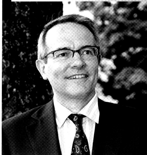
Bat chars 17