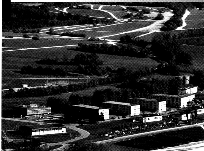
La place d'armes de Bure, vue du ciel. L'armée a investi dans le développement d'un Centre d'instruction au combat (CIC) et d'un village d'exercice (Nalé). La revalorisation des casernes de troupes est prévue dans les années à venir.