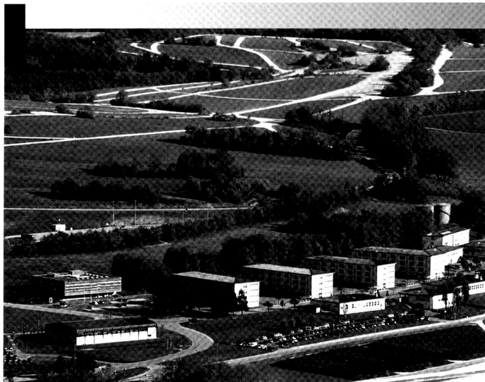
La place d'armes de Bure, vue du ciel. L'armée a investi dans le développement d'un Centre d'instruction au combat (CIC) et d'un village d'exercice (Nalé). La revalorisation des casernes de troupes est prévue dans les années à venir.