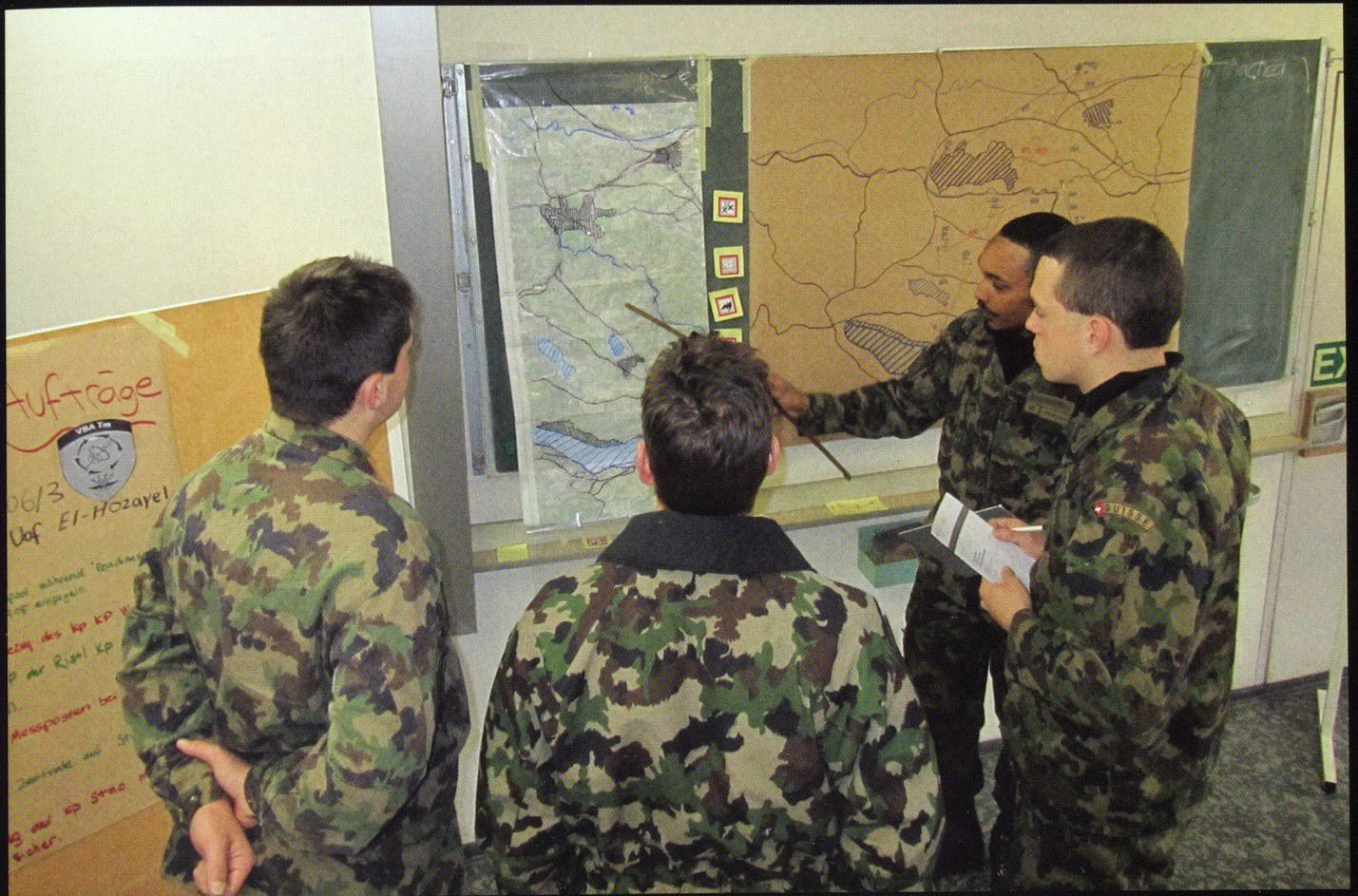
Le travail d'état-major et la prise de décision s'entraînent sur carte et papier, mais aussi sur les supports informatiques dernier-cri.