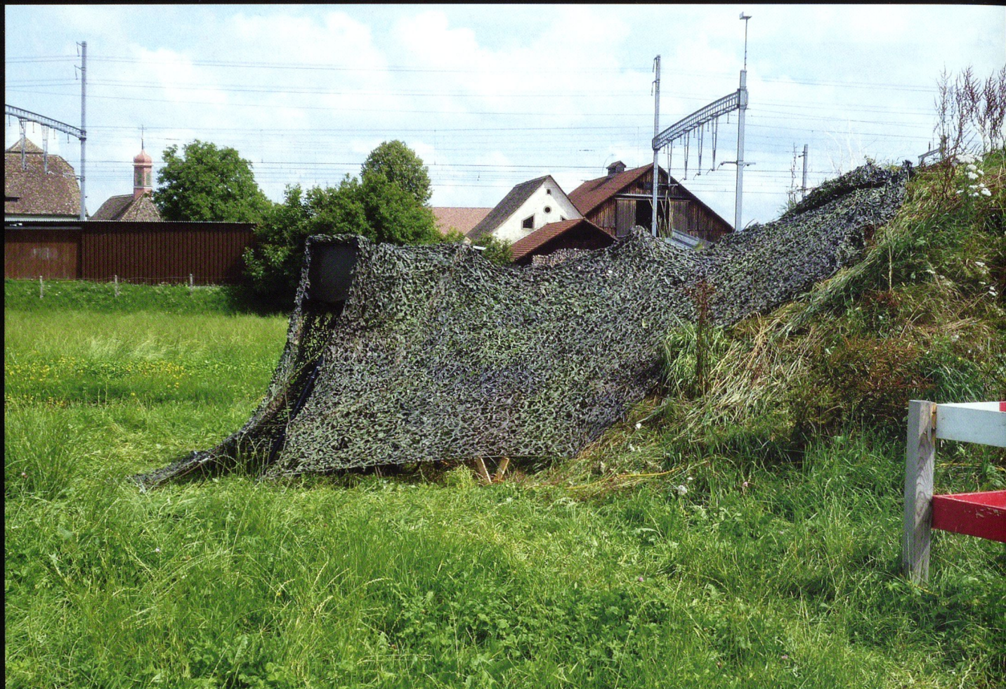
Plusieurs versions spécialisées du Piranha III sont utilisés pour l'aide au commandement: notamment en tant que brouilleur dans les actions de guerre électronique (CGE).