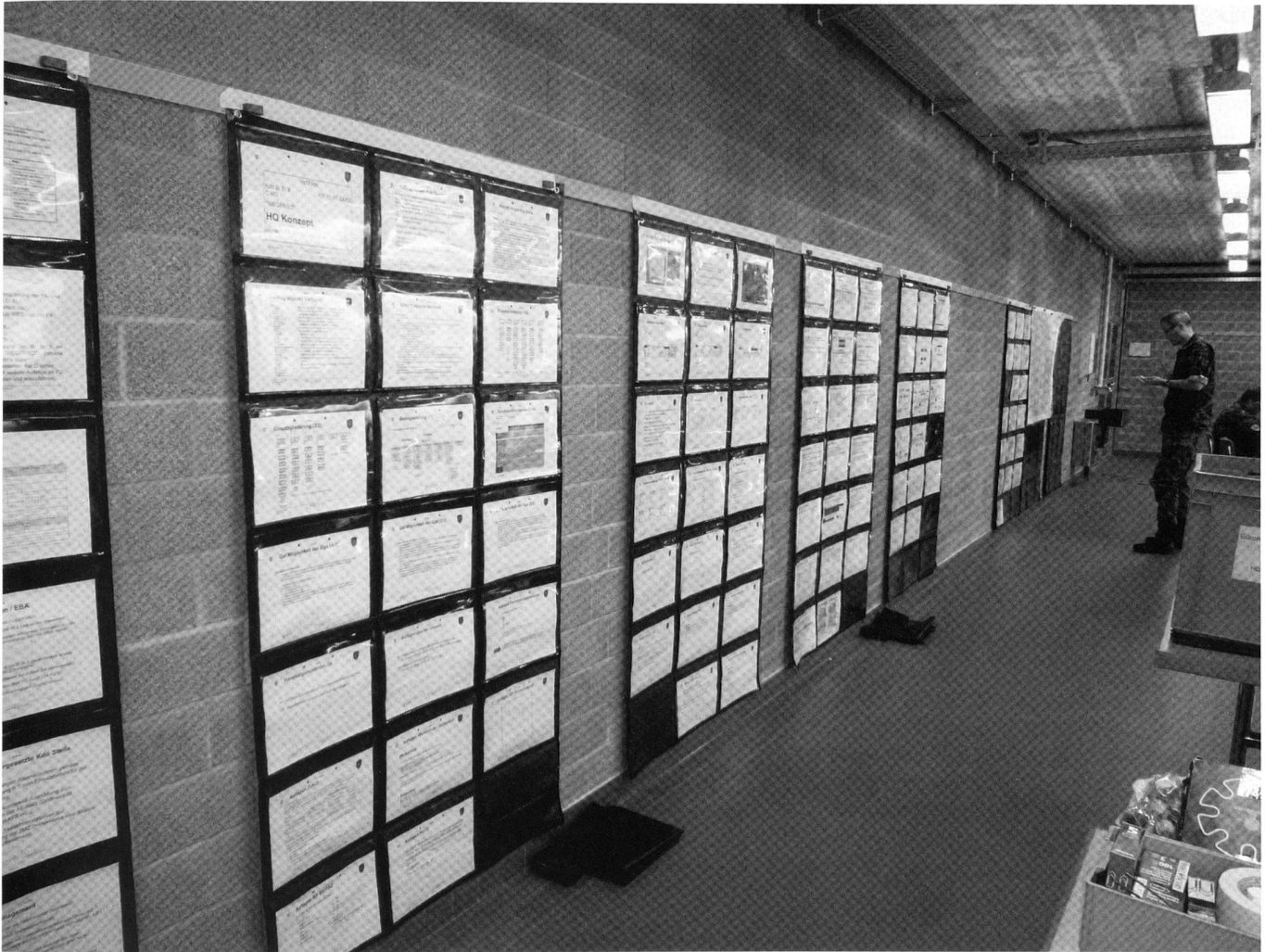
Mur de concepts durant un stage de formation technique.

de niveau bataillon, les stagiaires sont instruits dans les connaissances techniques spécifiques, la planification et la conduite d'engagement de moyens télématiques. Les aides de commandement des Grandes unités suivent un stage les instruisant à la doctrine, la planification et la conduite d'engagement de moyens télématiques et servant à approfondir leur connaissances techniques des systèmes. En automne, les participants au stage de formation technique de l'aide au commandement des Forces aériennes sont également intégrés aux formations.