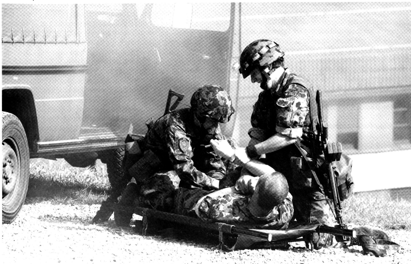
Recrues en pleine instruction militaire de base.