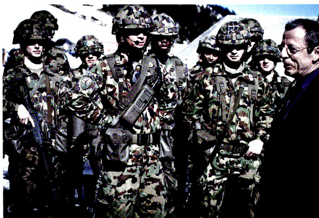
La «Une de fer» accueille le président du Grand Conseil vaudois.

Regardez aussi la situation dans les différents corps de police. Les exigences lors des recrutements sont sans cesse à la baisse. Voulons-nous la même chose pour notre armée ?