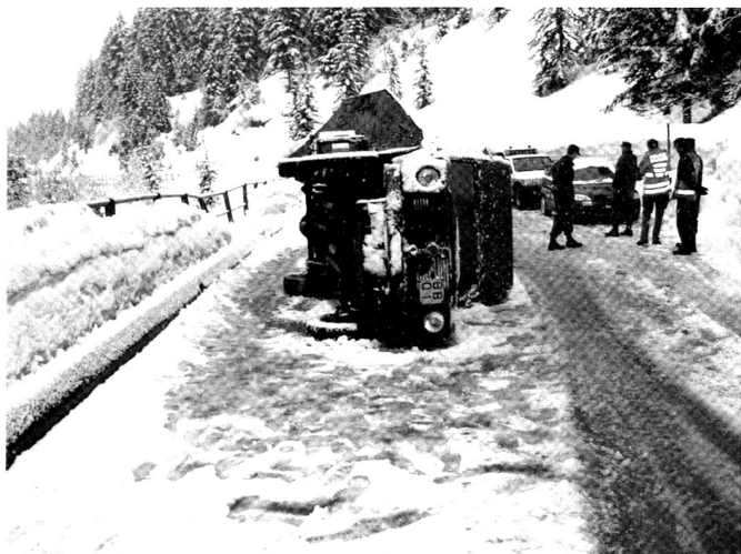
Accident de la circulation survenu le 28 mars 2006 sur la place d'armes de l'Hongrin (Vaud), sans blessé. Le Juge d'instruction a adressé son rapport au edf en proposant un règlement disciplinaire.

Pour illustrer les tâches et les compétences du juge d'instruction militaire, prenons deux exemples inspirés de la pratique judiciaire actuelle, en Suisse et à l'étranger : celui d'un vol de munitions et d'intensificateurs de lumières résiduelles (ILR) durant un service d'instruction en formation (SIF) et celui d'une divulgation de secrets militaires à des tiers. Lorsque le suspect est un militaire en service au sein de la troupe au moment de la découverte des infractions, le commandant d'école si le militaire est en formation, ou le commandant de bataillon si l'infraction a lieu lors d'un SIF, peut interroger le militaire concerné avant d'ordonner une enquête pénale. Ses déclarations peuvent être consignées dans un procès-verbal. Le suspect peut faire l'objet d'une détention provisoire sur l'ordre d'un supérieur pour une durée qui ne peut excéder 24 heures à compter de l'appréhension. Lorsque les actes délictueux ont été commis en-dehors du service, il appartient à l'auditeur en chef d'ordonner l'ouverture d'une enquête pénale. L'intervention du juge d'instruction. Dans l'un et l'autre cas de figure, le commandant d'école, de bataillon ou l'auditeur en chef doit faire appel au juge d'instruction militaire en lui adressant à cette fin une ordonnance d'enquête. En fonction des circonstances, les mesures prises peuvent être les suivantes :