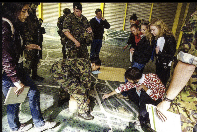
Z-LEAD : Prise de décision sur carte par deux équipes de participants.