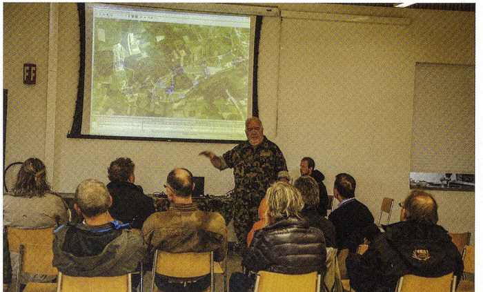
Le cdt C Dominique Andrey, commandant des Forces Terrestres, devant l'exécutif du canton de Glaris in corpore , le 25.09.