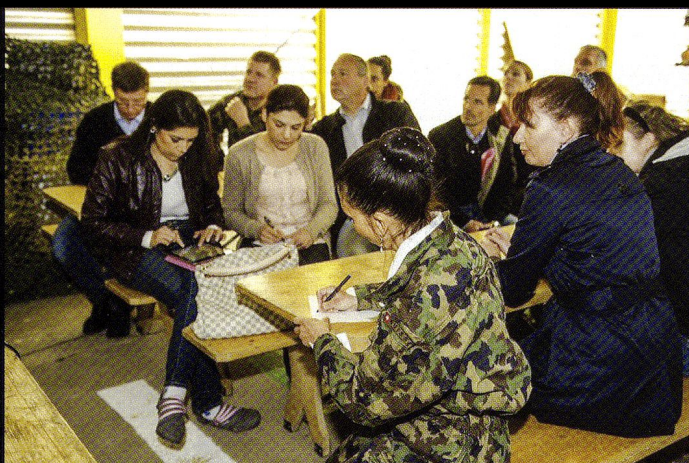
Z-LEAD, le 19.09. Une vingtaine de participants de l'Association suisse des cadres (ASC) et d'autres institutions reçoivent une introduction à un exercice tactique.