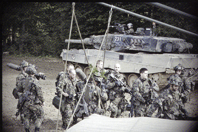
La section Delarive, au Rondat Nord.