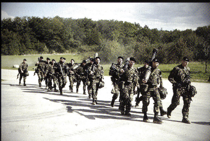
La section Bucher, de retour de l'exercice au Rondat Sud.