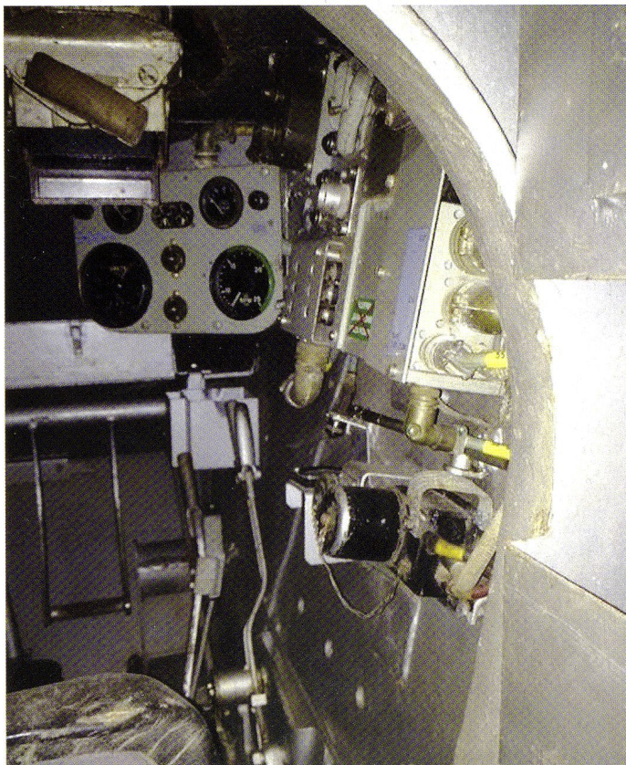
L'intérieur du char 55, revalorisé en 1960, bien conservé pour son âge...

Nous avons ensuite poncé entièrement le char. Le temps nécessaire est considérable, car le char a une grande surface avec beaucoup de détails. Par la suite, nous avons protégé les parties qui n'étaient pas à peindre.