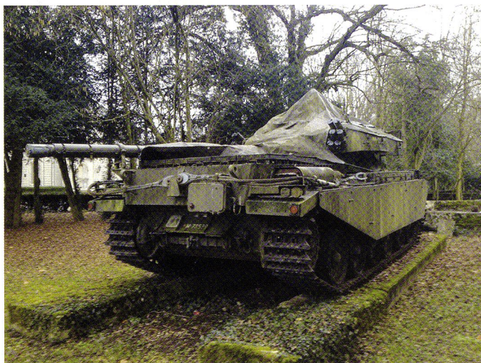
Le char 55 « en l'état » chez son ancien propriétaire, à Bellevue (GE). Il avait été acquis par un privé en 1982.