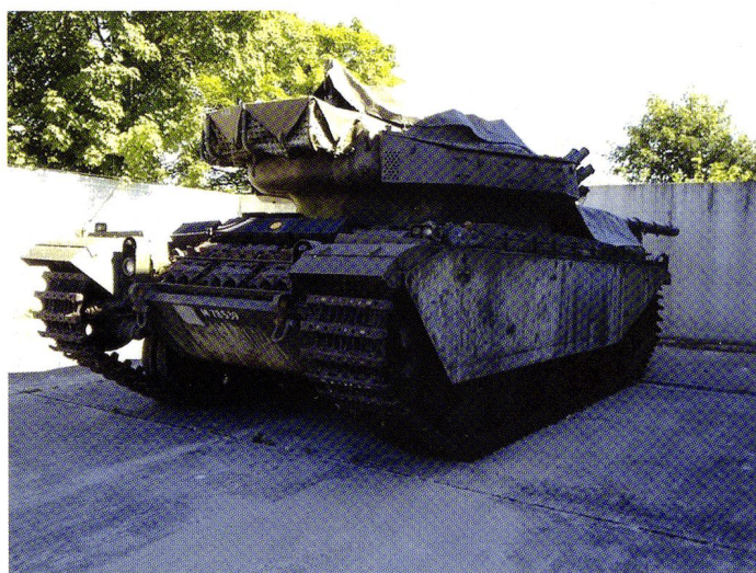
Le Centurion amené à Aïre-la-Ville, où a pu avoir lieu la restauration.