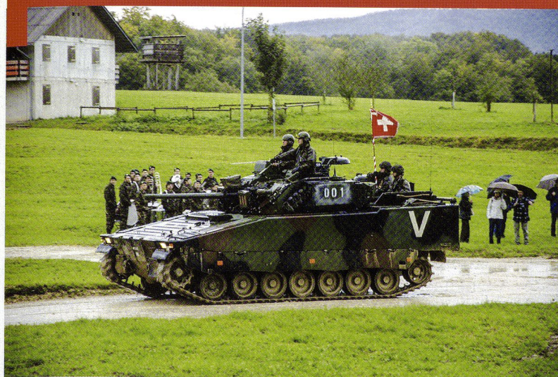
Bat chars 17