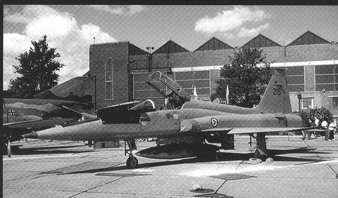
Ci-dessous : F-16A norvégiens à l'entraînement (gauche) et au-dessus des Balkans (droite).