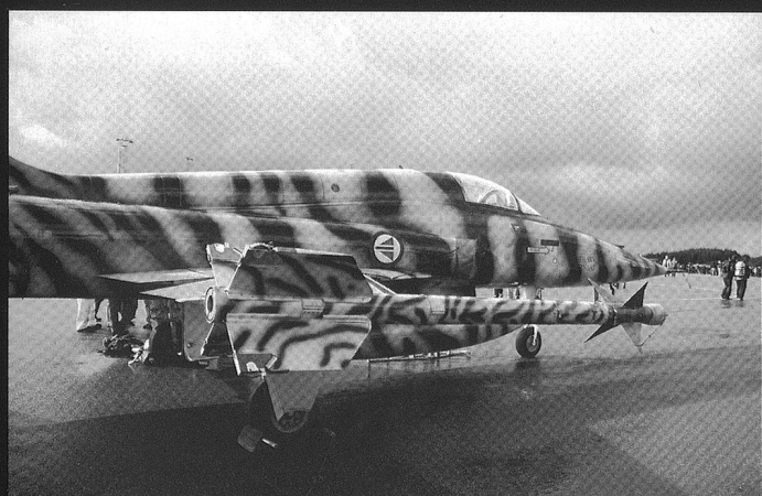
La flotte de F-5 norvégienne est sennée être remplacée à l'horizon 2020.