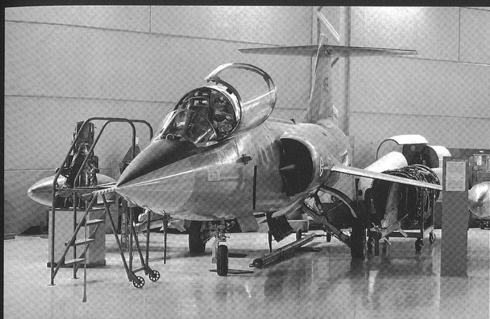
La Norvège fait partie du « club » F-104/F-16 européen. Ci-dessus, un biplace TF-104G.