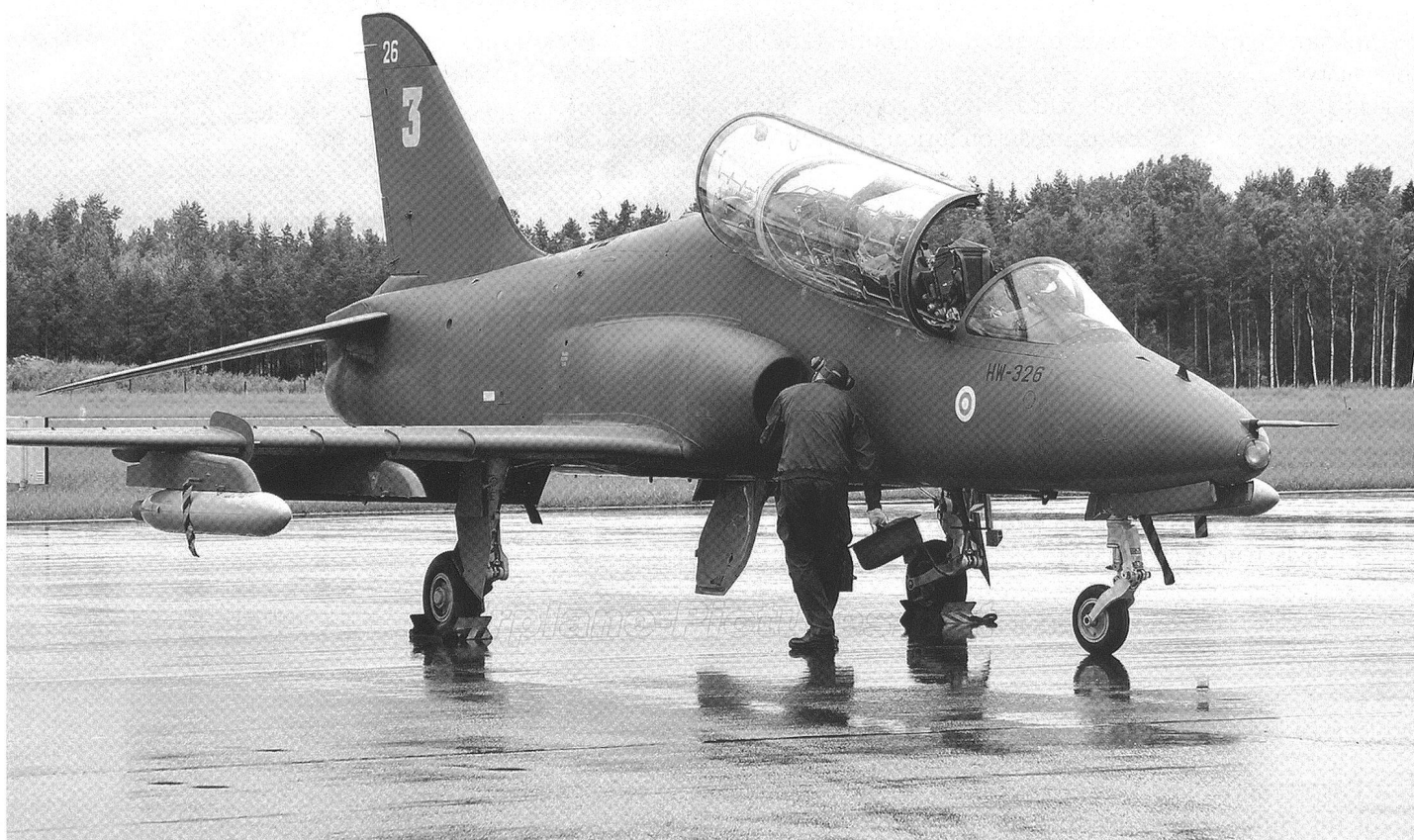
Le Hawk est également utilisé par la patrouille acrobatique finlandaise, les « Midnight Hawk. » Tout comme les « Red Arrows » britanniques.