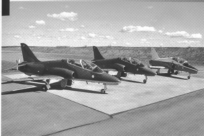
Le Hawk finlandais décliné dans ses trois versions, de gauche à droite : le Mk.51 camouflé vert/noir, le Mk.51A MLU désormais repeint en gris et enfin le Mk.66 dans sa livrée rouge/blanc ex-Forces aériennes suisses.