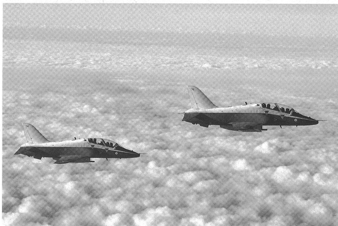
Les deux premiers Hawk ex-suisses dans le ciel finlandais.

En 2006, les entreprises d'armement d'Etat finlandaises ont fusionné sous le nom de Patria. En décembre de la même année, la nouvelle entité reçoit un contrat pour la revalorisation à mi-vie (MLU) de la flotte de Hawk , comprenant une vérification de la cellule et un nouveau