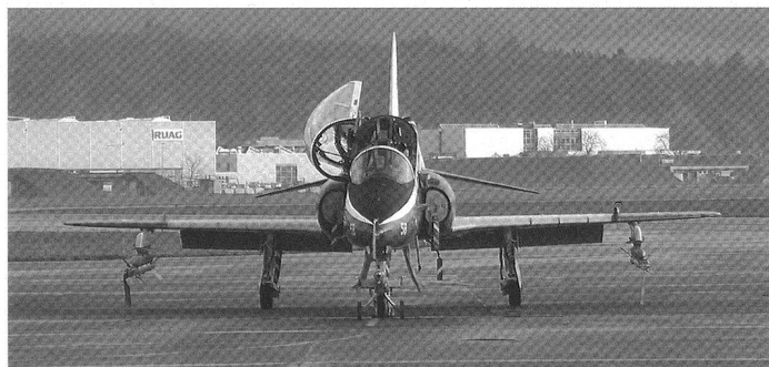
Les Forces aériennes suisses ont achetés en 1992 20 Hawk Mk.66, utilisés jusqu'en 2002. Deux appareils ont été perdus au cours d'accidents.

En plus de bombes d'exercice, les Hawk suisses pouvaient recevoir un canon de 30 mm, ainsi que le missile air-air Sidewinder .