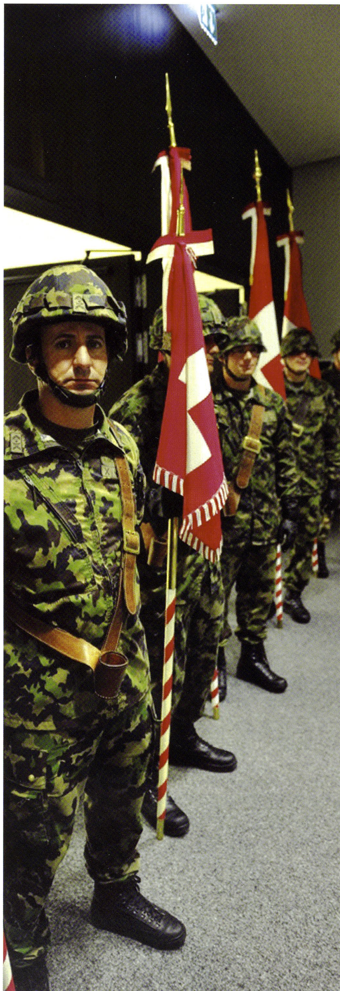
Les étendards de la région territoriale 1, à Interlaken le 12 octobre 2012.

Les objectifs du divisionnaire Favre sont les suivants : garantir la capacité à l'engagement, garantir la conduite des engagements subsidiaires, assurer l'aide en cas de catastrophe, poursuivre les entraînements dans les cadres aéroportuaires – dès aujourd'hui également à Belp Le bataillon acc 34 sera engagé au profit du canton du Valais. Le bataillon acc 1 sera entraîné à Genève au mois de mai, avec notamment l'exercice INTER 13 (20-24.05.2013) testant l'interopérabilité franco-suisse. Le bataillon d'infanterie de montagne 30 sera engagé