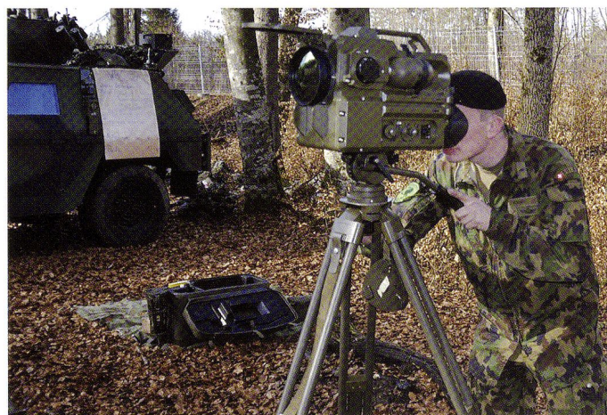
Instruction WBG 90 dans le cadre de l'IAE SUBVENIO.