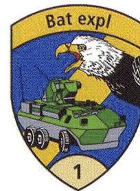
La cp expl 1/1 à Avenches.