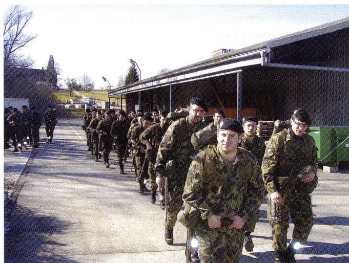
Cp chass chars à la marche d'entrée en service.