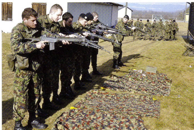
Instruction d'urgence à l'entrée en service.