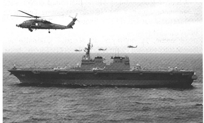
Le JMSDF Hyuga (DDH 181), porte-aéronef de 13'950 tonnes. Deux construits.