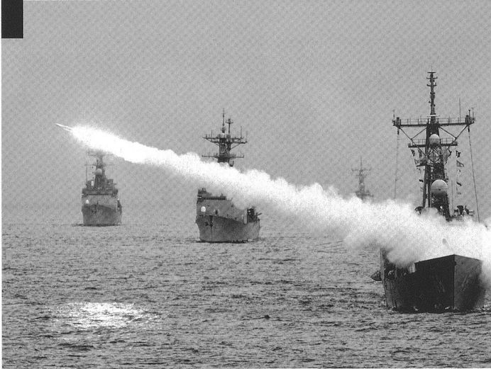
Tir d'un missile Standard SM-1 à partir de la frégate américaine FFG-48 USS Vandergrift , lors de manoeuvres conjointes avec les forces d'autodéfense japonaises en 1996.