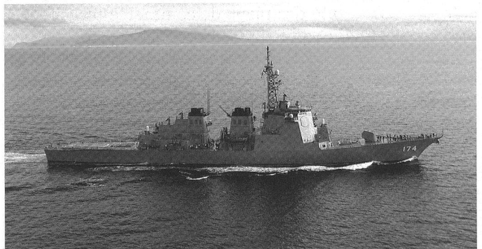
Le Japon déploie 4 destroyers Aegis de la classe Kongou de 7'250 tonnes et 2 navires de la classe Atago , disposant d'un hangar pour hélicoptères. Ici, le Kirishima (DDG 174).