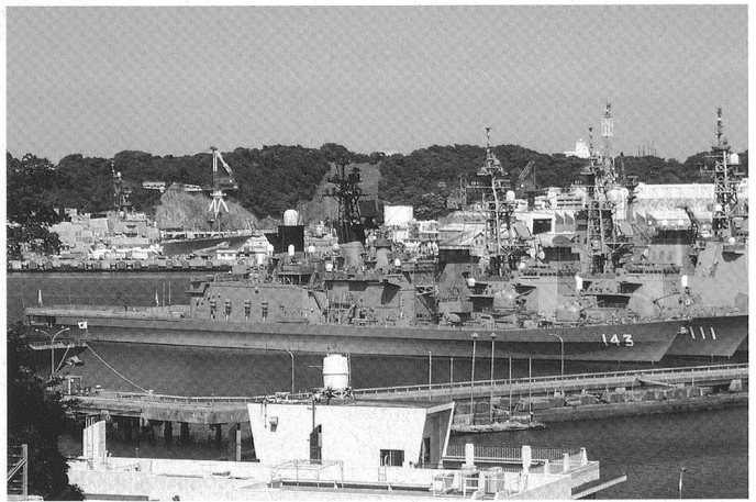
Le destroyer JMSDF Shirane (DD 143) de 5'200 tonnes. Deux navires construits.