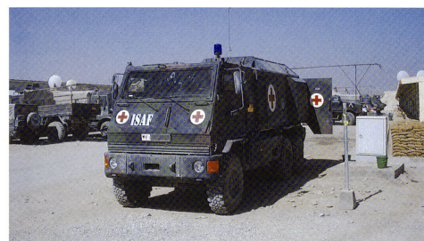
473 Eagle IV ont été commandés par la Bundeswehr, ainsi que 31 ambulances Yak sur châssis Duro III . Ci-contre, les nouveaux venus : Panzerhaubitze et Boxer .