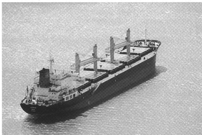
Les navires Romandie et Lavaux . @ Suisse-Atlantique.