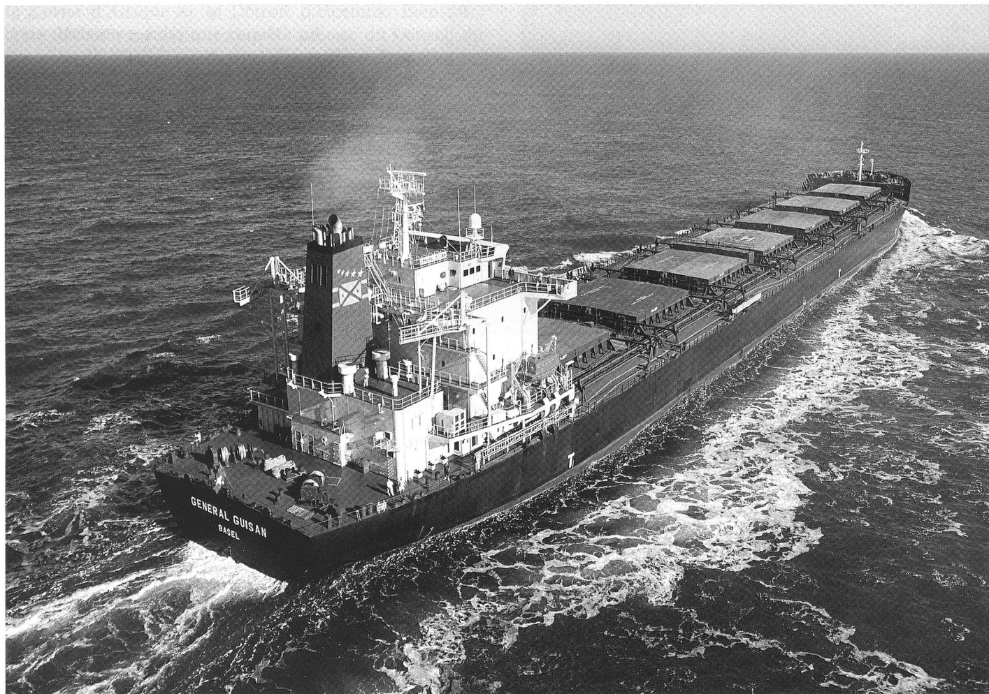
Ci-dessus le Général Guissan et à droite le Norasia Sils .

maîtriser. A cet effet, la communauté internationale a créé l'IMO (International Maritime Organisation) à Londres. Cette agence a été créée en 1958 et s'occupe de la sécurité (security and safety) en milieu maritime. Elle a édicté plus de 50 Conventions comportant des normes, des directives et des conseils qui sont suivis par la plupart des pays concernés.