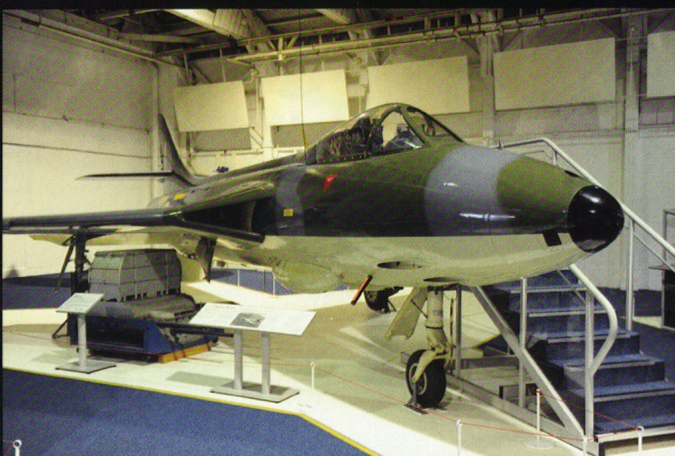
Le Hunter (ici un des derniers modèles : FGA9) a connu une brève carrière au sein de la RAF. Mais il a impressionné les foules, par ses démonstrations acrobatiques (Black Arrows – Sqn 11).