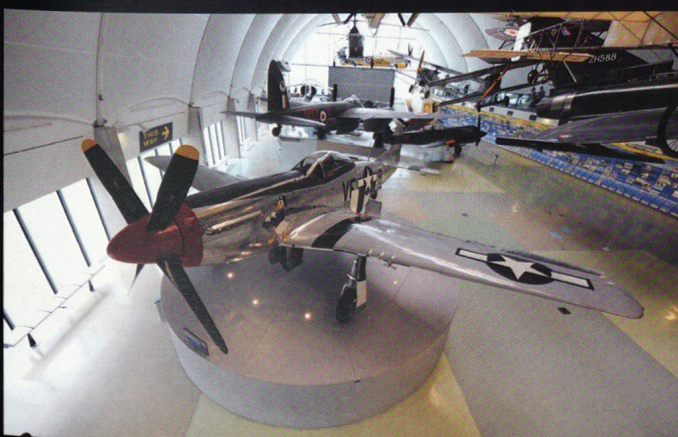
Un P-51 Mustang , armé de 6 mitrailleuses de 12,7 mm.