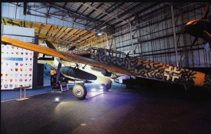
Le concept de « chasseur lourd » Bf 109 n'a pas été un grand succès. Mais l'appareil a pu se reconverter dans la chasse nocturne.