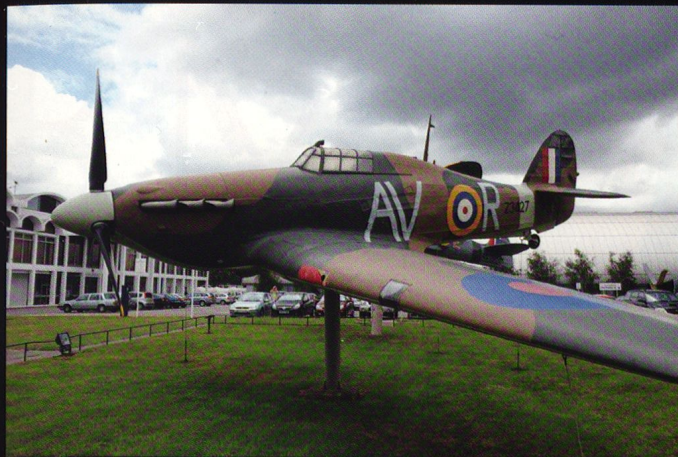
Le Hurricane , cheville ouvrière du Fighter Command durant la bataille d'Angleterre de 1940. Celui-ci porte le code (AV) du 121 «Eagle» Squadron de la RAF.