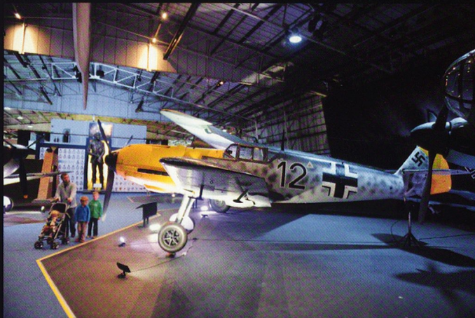
Un Messerschmitt Bf-109 E aux couleurs de la Luftwaffe durant la bataille d'Angleterre. Il emporte un canon de 20 mm et deux mitrailleuses de 7,9 mm.