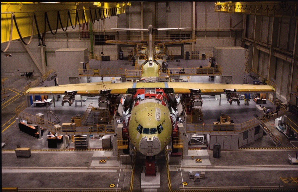
L'A400 dans sa halle d'assemblage.