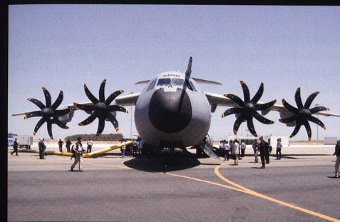
Deux illustrations montrant la présentation officielle ( rollout ) de l'A400M, en Espagne.