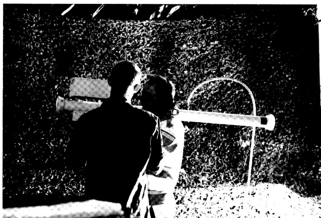
A Dübendorf, les spectateurs ont pu essayer nos simulateurs de tir mobiles.

Vers 1800, la fête s'est terminée par un concert du Swiss Army Big Band, donnant une ultime touche musicale sur cette belle journée qui a consacré les 75 ans de la DCA.