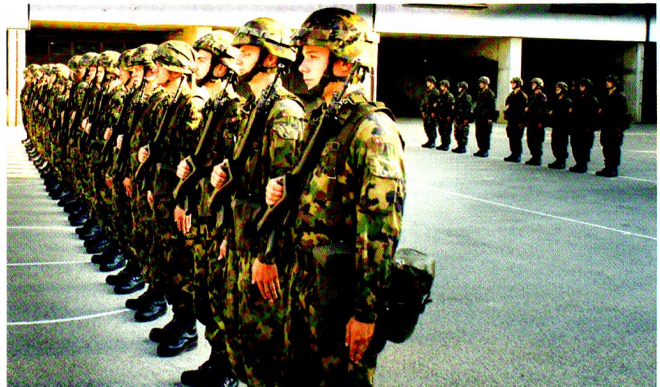
Présentation formelle de la compagnie logistique, au départ de son exercice de 48 heures, ZOUBIDA, le 24 août 2011.

Le lendemain, la cp log a reçu la mission d'effectuer un ravitaillement tactique d'une compagnie de chars