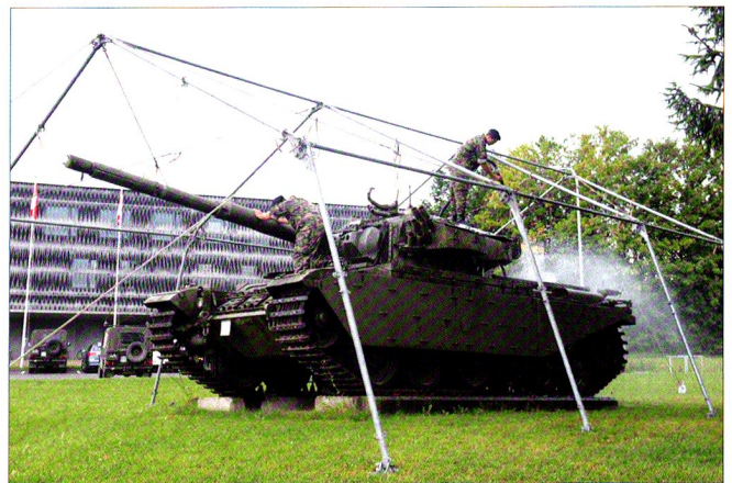
Giclage et ponçage du char 57, devant le bâtiment 15.

Cap Philippe Chevalier Of NBC, EM bat chars 17