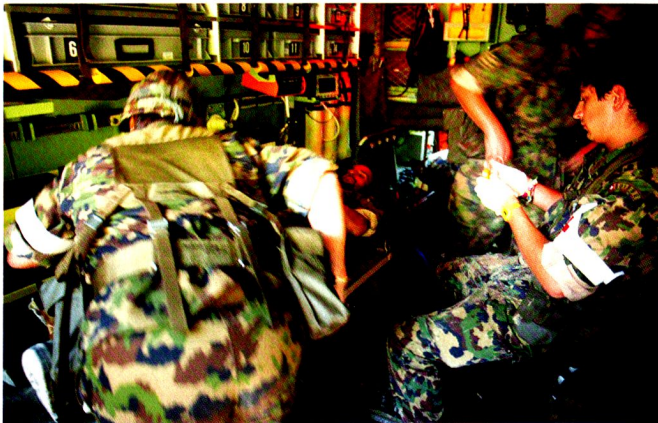
Les exercices d'engagement sanitaires ont eu lieu, pour la plupart, durant les pauses de combat entre les exercices, afin de ne pas diminuer l'intensité de l'instruction.