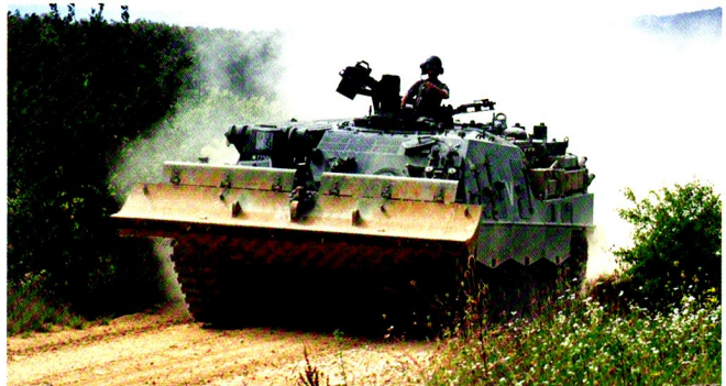
L'équipage du char de dépannage Buffel a vu du pays durant le CR 2011...