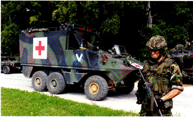
L'ambulance blindée San Piranha a été de piquet 24/7 et a été engagée dans de nombreux exercices de compagnie.