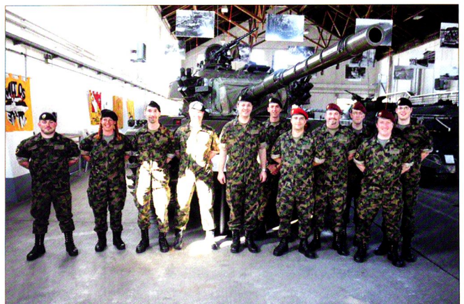
L'état-major du bataillon de chars 17 à l'issue des JTEM et du cours d'introduction Leo WE , au musée des chars de Thoune, devant le char 55 Centurion .