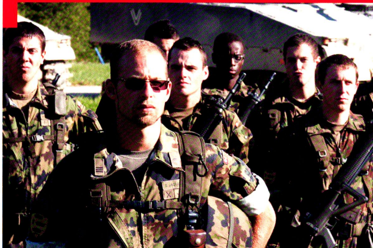
Cp log chars 17