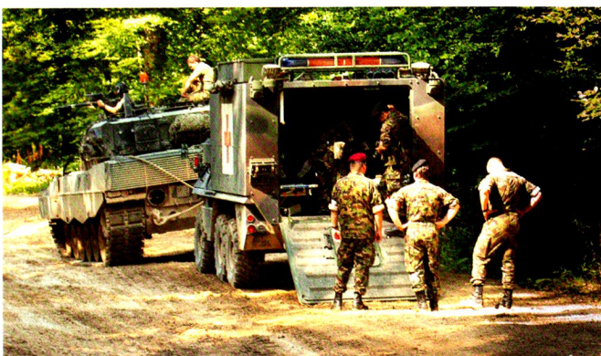
La direction d'exercice -épaulée par une équipe photo- suit le déroulement des engagements sanitaires, afin de documenter son évaluation.

à un point fixe. Les mesures d'urgence concernant cet engagement (préparation du matériel et des véhicules) ont été prises immédiatement. Un détachement avancé a reconnu l'emplacement du ravitaillement. Par la suite, le détachement avancé et la citerne de ravitaillement montée sur un véhicule (BBC) ont pris un secteur d'attente. Après avoir reçu la confirmation des coordonnées du point de contact, la BBC a été déployée avec succès. Le dispositif mis en place a permis d'orienter puis de ravitailler 11 chars Léo WE et 2 CV90 dans un bref délai. La BBC permet en effet, en engageant deux spécialistes carburant, d'effectuer le ravitaillement de 4 chars simultanément. Le dispositif a ensuite été préparé au départ en quelques minutes. La troupe est rentrée un peu plus de 3 heures après avoir reçu cette mission. Ce ravitaillement tactique a permis à certains de découvrir les possibilités logistiques actuelles, a été pour les autres un rafraîchissement bienvenu et pour tous, un exercice apprécié et couronné de succès. Notons en outre que cette mission a été reçue durant la période durant laquelle la sct rav/évac devait assurer l'organisation et le ravitaillement en subsistance. Les cadres ont donc dû engager toutes leurs réserves.