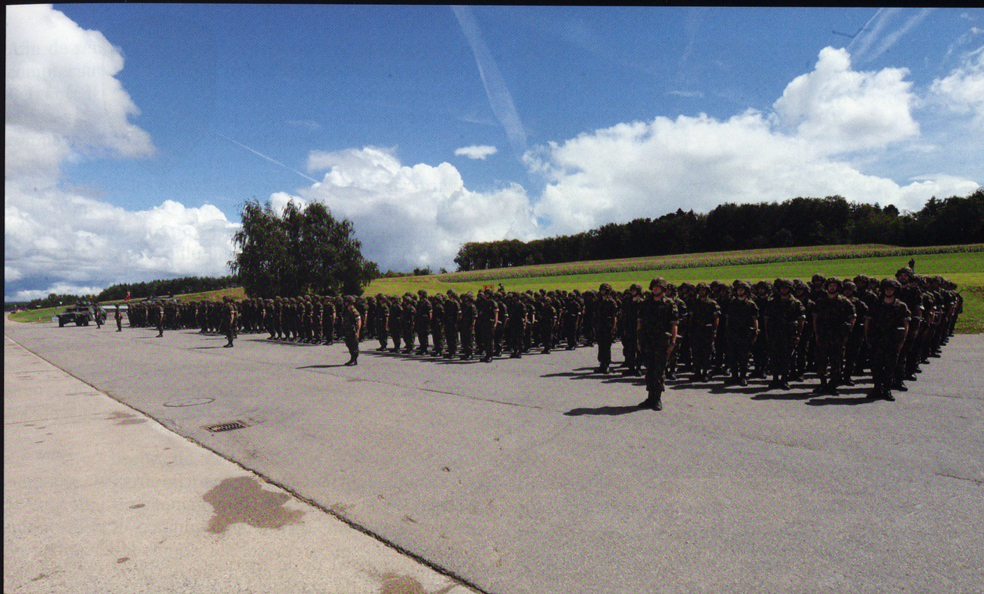
Ci-dessus : Prise de l'étendard du bat chars 17, le 15.08.2011 à Bure. Ci-dessous : donnée d'ordres de l'exercice de bataillon, à Nalé ; et visite de corps à la fin du CR.