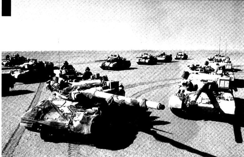
Le 4 e Régiment de Dragons (RD) a été constitué de trois escadrons professionnels, issus de toutes les unités blindées disponibles.