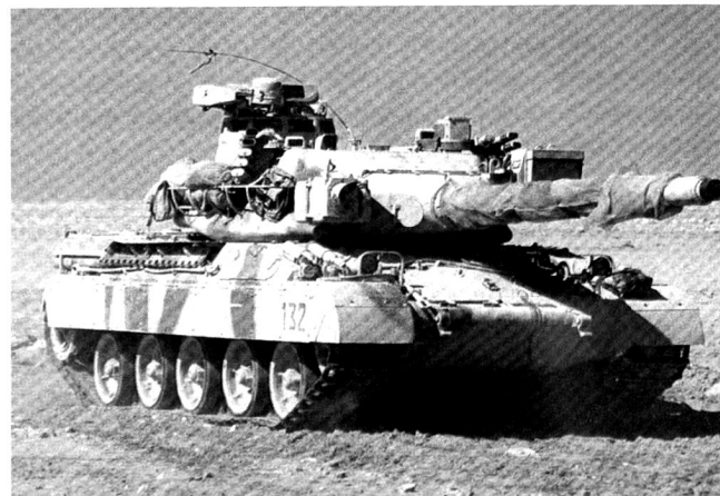
L'AMX30 emporte un canon de 10.5 cm, un canon de 20 mm et une mitrailleuse de 7,62 mm.