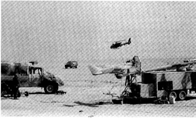
L'appui aérien a été massif. Sur cette photo, un hélicoptère Gazelle survole une station de drones MART.

entrée en Irak sans perte de temps. C'est ce que vous a raconté le général Derville.