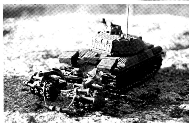
Ci-dessus : deux vues du système de déminage KMT-S, développé par GIAT à partir de l'AMX-30. Le système peut être téléopéré.