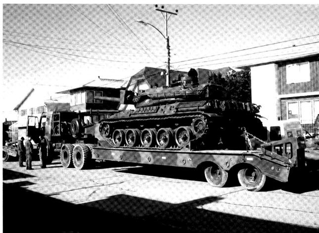
Déplacement d'un « B2 » sur un véhicule porte-char.