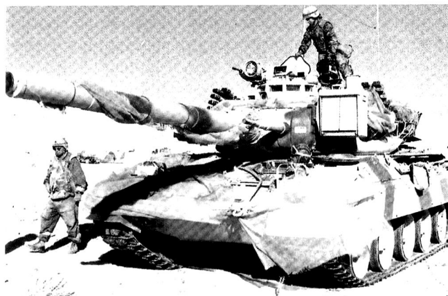
Présentation d'un « B2 » à des soldats américains.